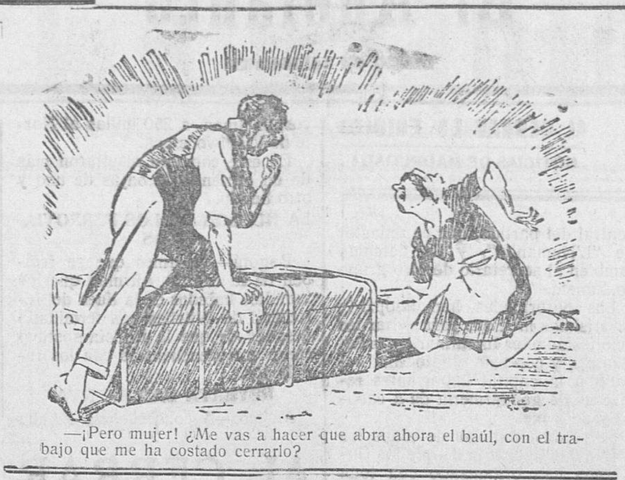
—Pero mujer! ¿Me vas a hacer que abra ahora el baúl, con el trabajo que me ha costado cerrarlo?

JOSE FRANCES Madrid, Julio, 1929. (Prohibida la reproducción).