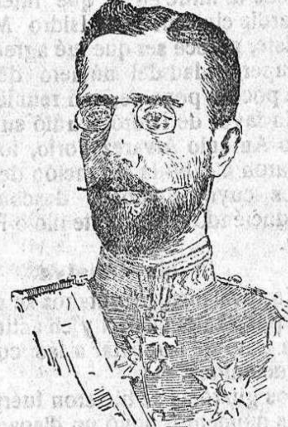
Oscar Gustavo de Suecia.

Nada se sabe de una manera concreta respecto a los asuntos en ella examinados y a los acuerdos adoptados. La conferencia ha sido impuesta por la necesidad en que se ven los países es-