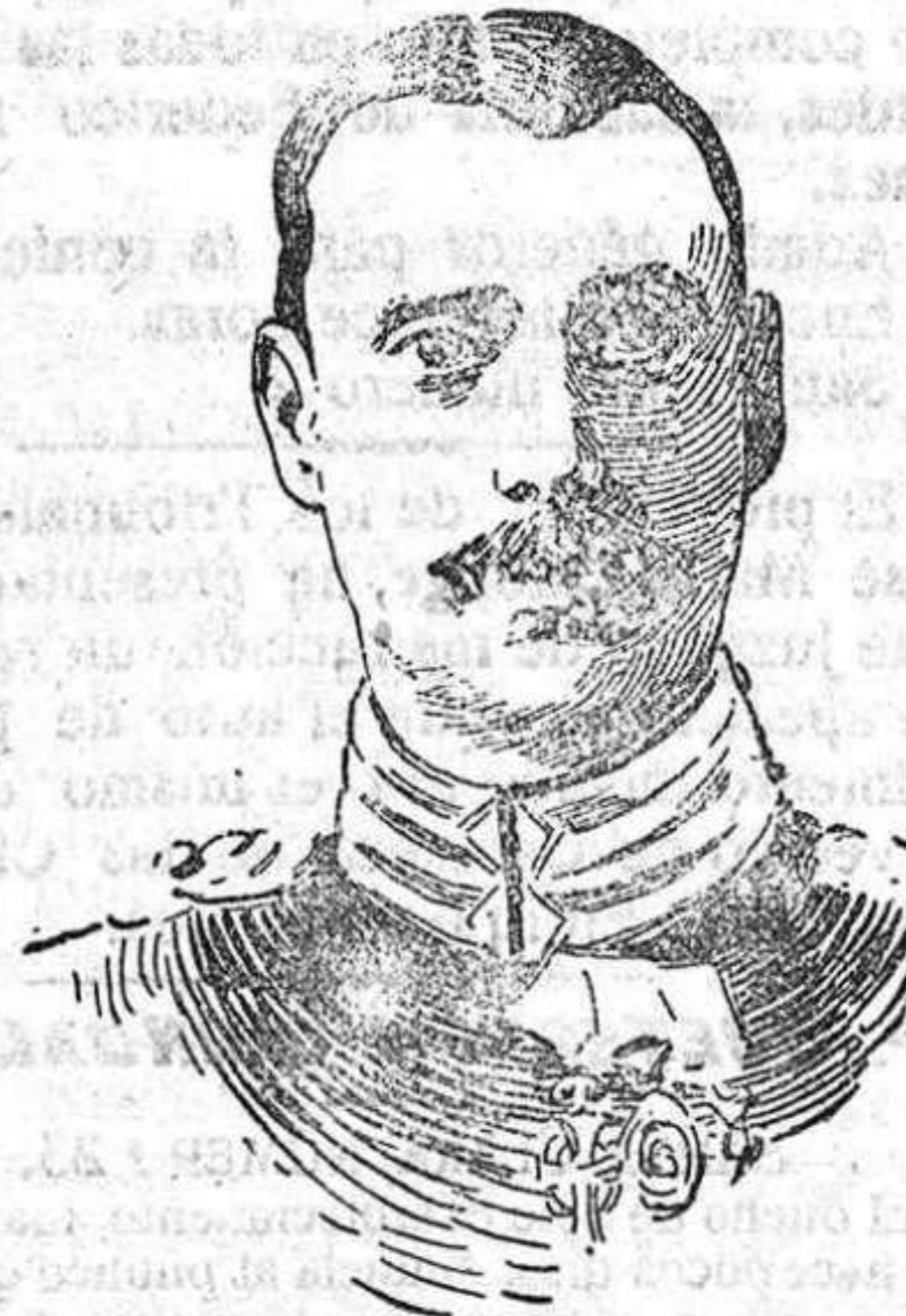
Cristián X de Dinamarca.

Como es lógico, es grande la expectación por conocer los acuerdos adoptados por los tres soberanos; pero nada se sabe de una manera indubitable hasta ahora. Lo que sí parece cierto, es que reinó absoluta unanimidad en la manera de apreciar los temas sometidos a