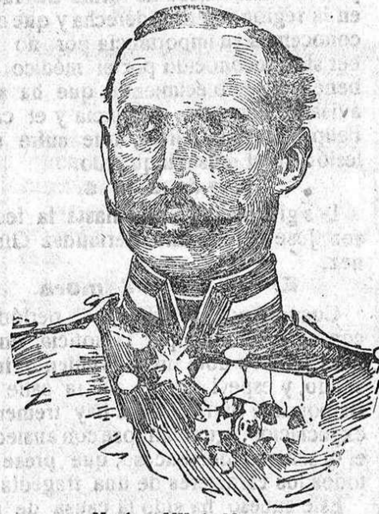
Haakon VII de Noruega.

condinavos de defender sus intereses morales y materiales, gravemente maltratados por resoluciones tomadas por Alemania e Inglaterra en particular, con motivo de la guerra. El cierre del mar del Norte acordado por Inglaterra y la colocación de minas fuera de aguas jurisdiccionales y en las rutas que siguen los barcos mercantes para llegar a los países del extremo norte de Europa, además de la no bien justificada inclu-