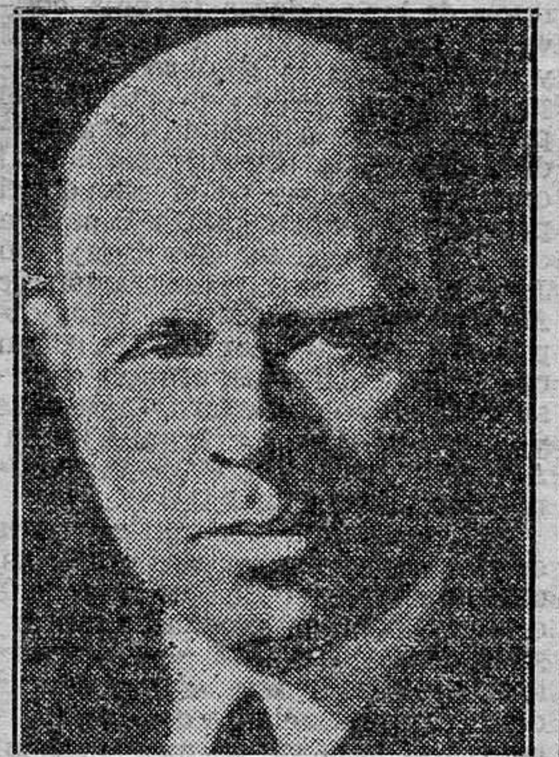
Pablo Casals, nombrado doctor "honoris causa" de la Universidad de Edimburgo

Vuelve de miron. Ahora sus tiempos de "punto", y de vez en vez