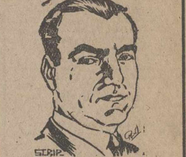
PREMIO NACIONAL DE LITERATURA «JOSE ANTONIO PRIMO DE RIVERA»

La Dirección General de Propaganda ha concedido este año el Premio Nacional de Literatura «José Antonio Primo de Rivera» al Subsecretario de la Presidencia, Excelentísimo señor don Luis Carrero Blanco, autor de la «La Victoria del Cristo de Lepanto»