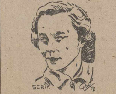
LA PRINCESA ANA DE BORBON Y PARMA, PROMETIDA DEL REY MIGUEL DE RUMANIA

Nápoles, 29.—Un helicóptero del portaviones americano «Midway», perdió hoy la hélice sobre esta ciudad, hizo explosión en el aire y se estrelló contra un hotel. Murieron dos de los tripulantes, y el tercero resultó herido. Las autoridades italianas manifiestan que las víctimas eran oficiales del helicóptero.—Efe.