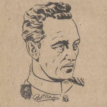
RICHARD EVELYN BYRD

Nuevo Embajador de La Argentina en Madrid que se halla en camino a bordo del “Cabo de Buena Esperanza”. Nació en Panamá, capital de la provincia argentina de Entre Ríos. Hizo sus estudios en la Facultad de Ciencias Médicas de Buenos Aires, hallándose especializado en Clínica. Ha trabajado en varios hospitales de la provincia de Entre Ríos y en el “Rames Mejía”, de Buenos Aires. Ha sido Diputado Nacional por su provincia de origen, en sucesivas legislaturas, desde 1932 a 1935. En la política anterior al advenimiento de Perón, perteneció al partido democrático. Es Presidente honorario del Club Atlético Surmiente y del Club Social Victoria.