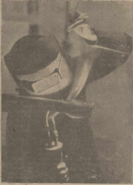
Soldador especializado de una fábrica de guerra con el traje protector que utiliza en su trabajo

En los sectores central y septentrional del frente del Este, las tropas alemanas, apoyadas por importantes contingentes de aviación, infligieron también numerosas bajas al adversario, en el curso de cruentos combates defensivos. En el este de Kursk tres cañones y varias ametralladoras fueron capturados o destruidos por un destacamento de choque.