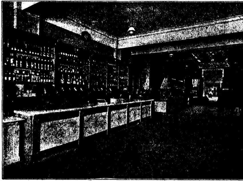
UNIO COOPERATISTA BARCELONESA - LOCAL DE VENDES, VILLARROEL, 163 SECCIONS DE PASTISSERIA - QUEVIURES - PA - PORC - CARN (PLANTA BAIXA)

El cos antic format pel casal que dona al carrer de Villarroel, conté totes les seccions de proveïment, les quals ocupen no sols la planta baixa, sinó els dos pisos de l'edifici, i on estan establertes les seccions de sastre-