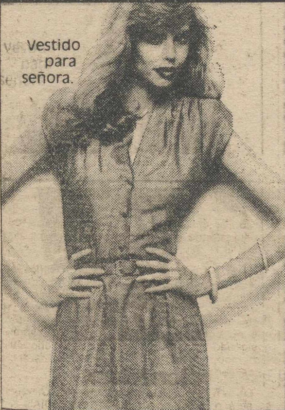
Vestido para señora.