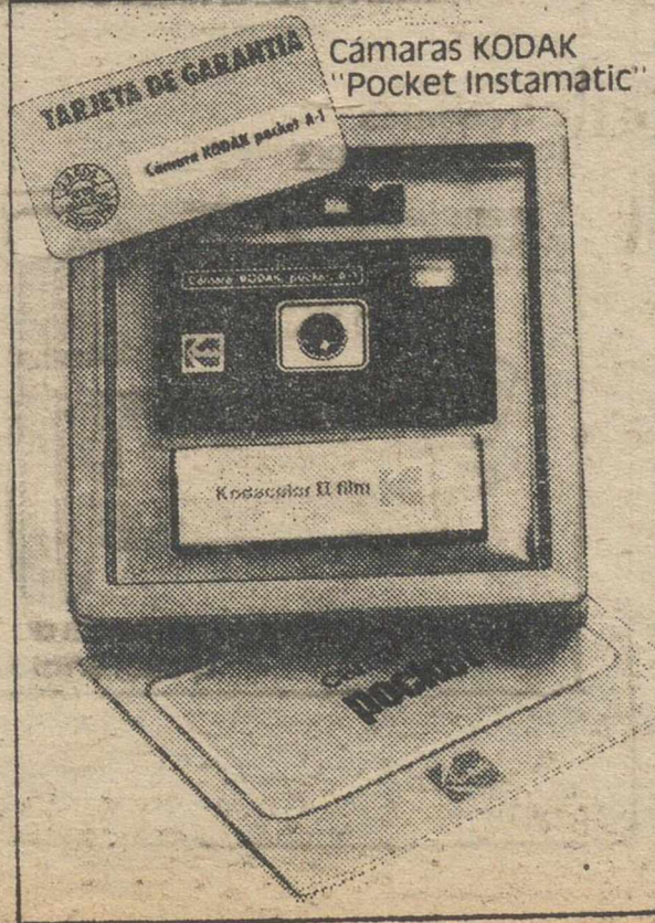
Cámaras KODAK "Pocket Instamatic"