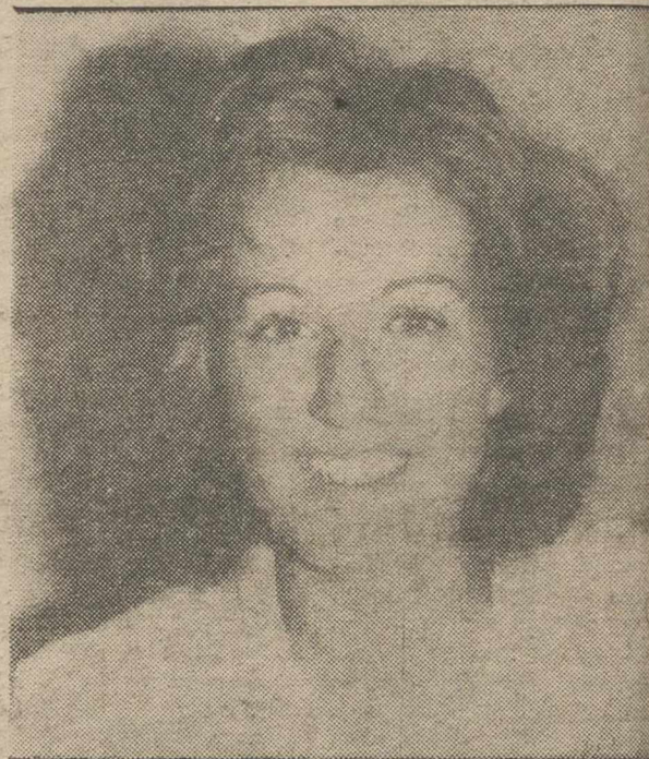
en Albacete (Sociedad Nacional de Avales para el Comercio), que hará que estas soluciones puedan hacerse realidad, facilitando los créditos precisos.

—Así es, por eso paralelamente a este gabinete la Cámara y el IRESCO van a implantar SONAVALCO