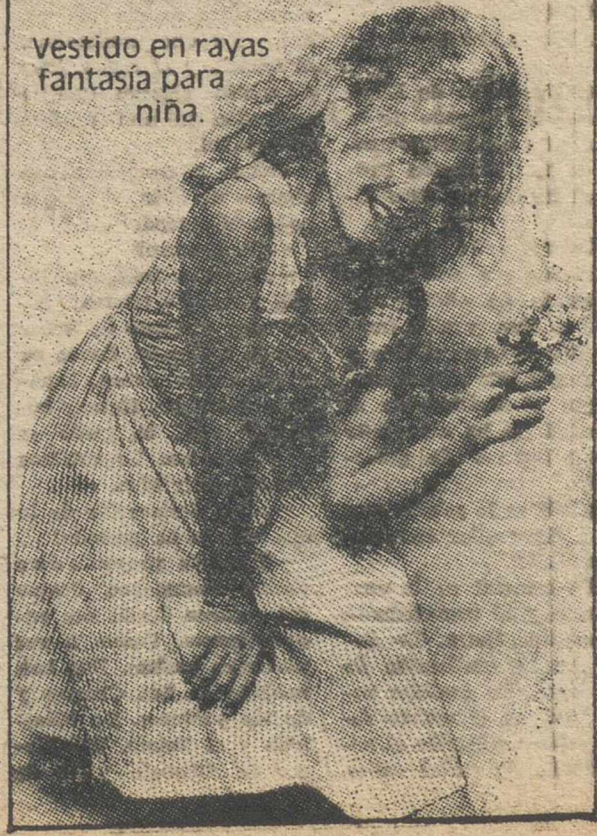
vestido en rayas fantasía para niña.