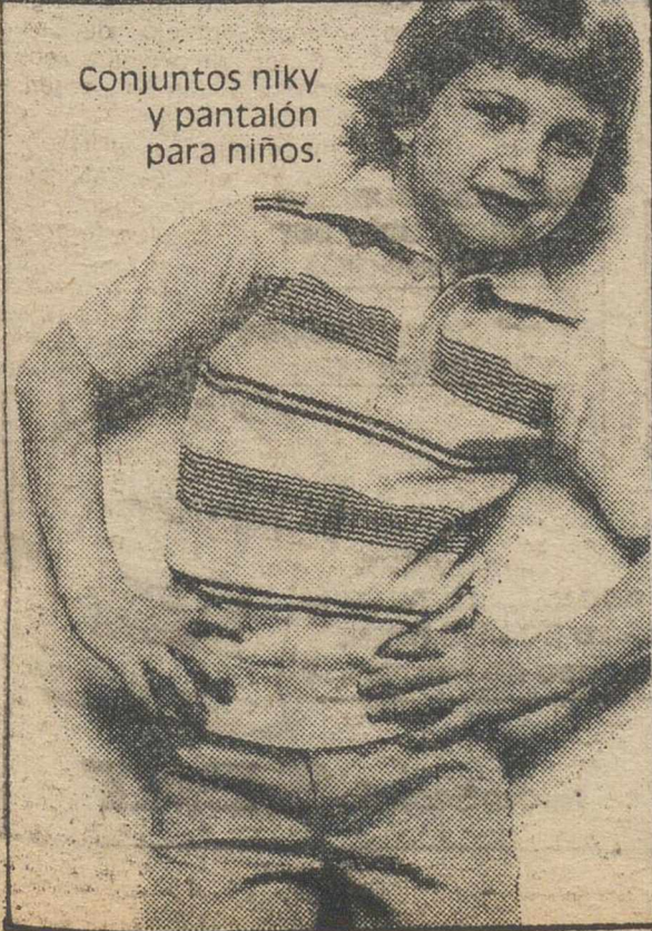
Conjuntos niky y pantalón para niños.