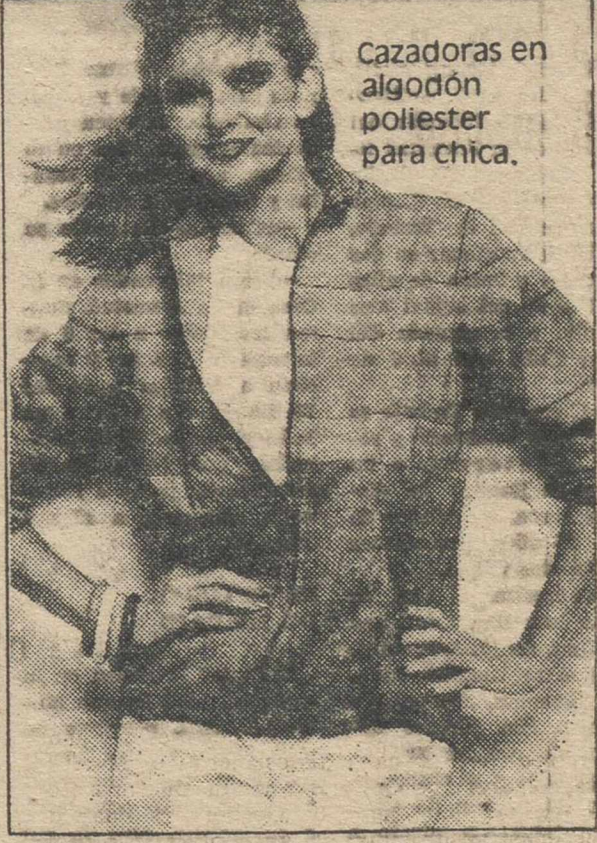
Cazadoras en algodón poliéster para chica.