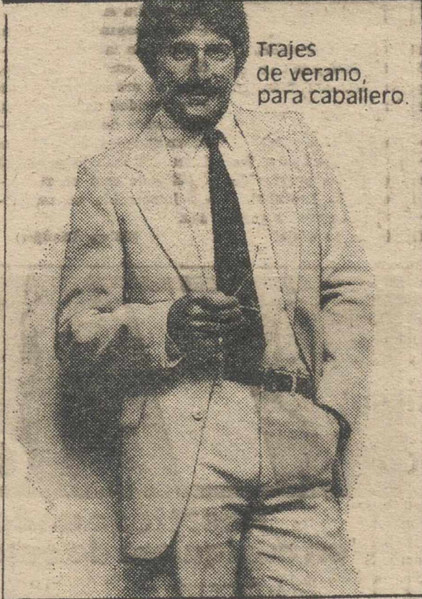
Trajes de verano, para caballero.