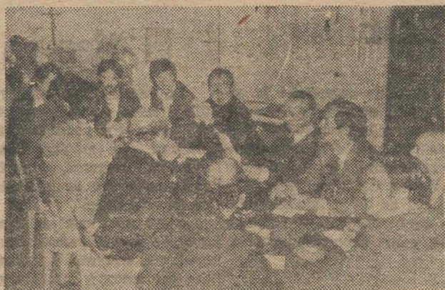
BAYONA (Sur de Francia).— Reunión en Bayona del Euzkadi, Buru Batzar con Leizaola.