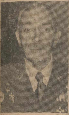
Arriba, el teniente general Vega Rodríguez que ha dimitido como jefe del Estado Mayor del Ejército. Abajo, el teniente general Tomás de Liners, probable sustituto.