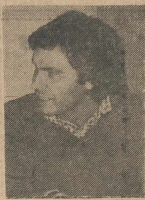
Villa ha cumplido su amenaza de hacer todo lo posible.

En relación con los resultados de las elecciones en Alicante y Asturias, Felipe González añadió que "se pueden buscar al gato todos los pies que se quieran, pero lo que está claro es que el PSOE ha ganado". Señaló, asimismo, que "Martín