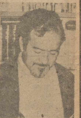
Artículo de Rodrigo RUBIO, en última pág.