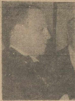
MADRID, 18 (Efe).— Felipe González, primer secretario del PSOE, ha dicho a

"Efe" que "Suárez ha cometido un grave error político: se plebiscitó a sí mismo en dos provincias, al pedir el voto no como presidente de un partido, sino como presidente del Gobierno. Ahora debe sacar las consecuencias".