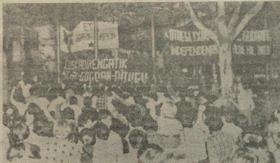
SAN SEBASTIAN. — Manifestación de unas 12.000 personas por las calles de la capital donostiarra, tras el funeral oficiado en la Catedral de San Sebastián con motivo del segundo aniversario de los fusilamientos de Txiki y Otaegui y tres miembros del FRAP.