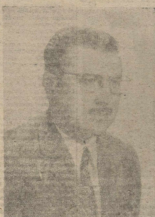
Luna, Estrella, Castillo, Buenavista, Torres y sellado de Plaza José Abellán, Tercia, General Sánchez, Marqués de la Calzada y Ruperto de Besga.

Pavimentación, aceras y en cementado de las siguientes calles: P. Abellán, Francos Rodríguez, Av. Grupo Escolar, Tejera, Travesía Eras, Eras, Ruperto de Besga, Sol, San José, Almazaras, Huertos, Capitán, Nueva, Alba, Travesía Nueva, Verse, Navajo, Romana, Alcántara, Rosario, Norte, La