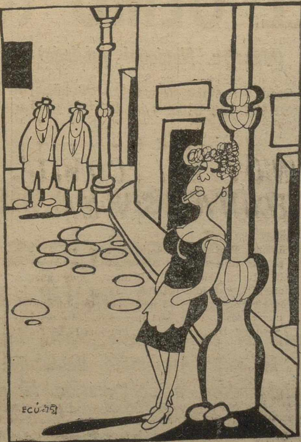
—Es una mujer de conducta dudosa... —¿Dudosa?