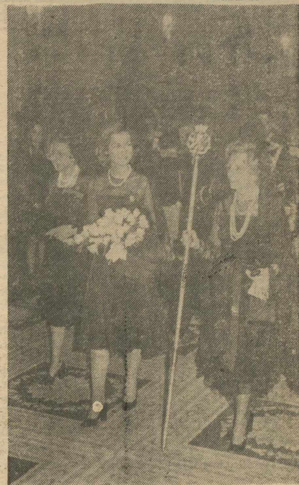
MADRID.—La Princesa doña Sofía, acompañada de la esposa del presidente del Gobierno y la duquesa de Cádiz, ha asistido al Capítulo de Damas de la Corte de Honor de Santa María la Real de la Almudena, en su fiesta anual.