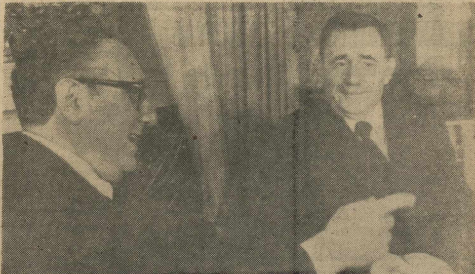
VIENA.—El secretario de Estado norteamericano, Henry Kissinger, bromea con su colega soviético, Andrei Gromyko, durante la primera tanda de conversaciones que han llevado a cabo en el Hotel Imperial, de Viena.

Entre otras cuestiones fue tratado el problema de Oriente Medio