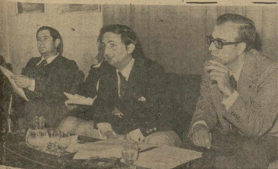
MADRID.—En el Club Internacional de Prensa, los miembros de la Comisión promotora de la nueva asociación política “Cambio Democrático”, han presentado su programa.—(Foto EUROPA PRESS).