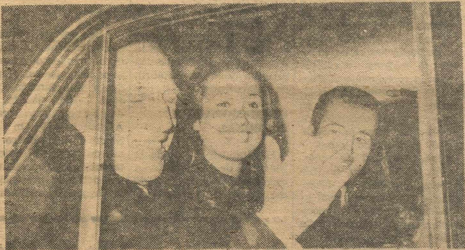
En la foto de archivo, se recoge la llegada al aeropuerto de Madrid Barajas de don Jaime de Borbón, padre de don Alfonso, con motivo de la boda de los duques de Cádiz.

(Viene de la PRIMERA) El nacimiento, se hallaban junto al duque de Segovia sus hijos don Alfonso de Borbón y Dampierre, duque de Cádiz, y don Gonzalo de Borbón y Dampierre.