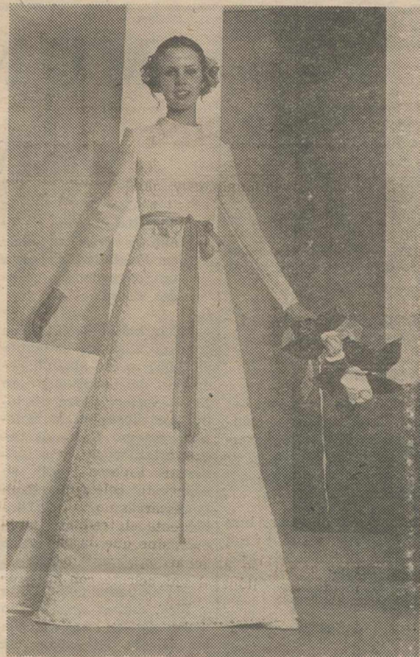
En este vestido de novia de José María Tresserra, los bordados recubren casi por entero el mismo, exceptuando parte del cuerpo y las mangas.

Hace algunos años, la confección del traje de novia era casi un rito para cuya práctica hacía falta perder tiempo en elección de tejidos de modelos y pruebas de modista. Es cierto que entonces, la mujer tenía tiempo de soltura para dedicar a tan agradable menester, en el que colaboraban también otras mujeres de la familia, además de la interesada.