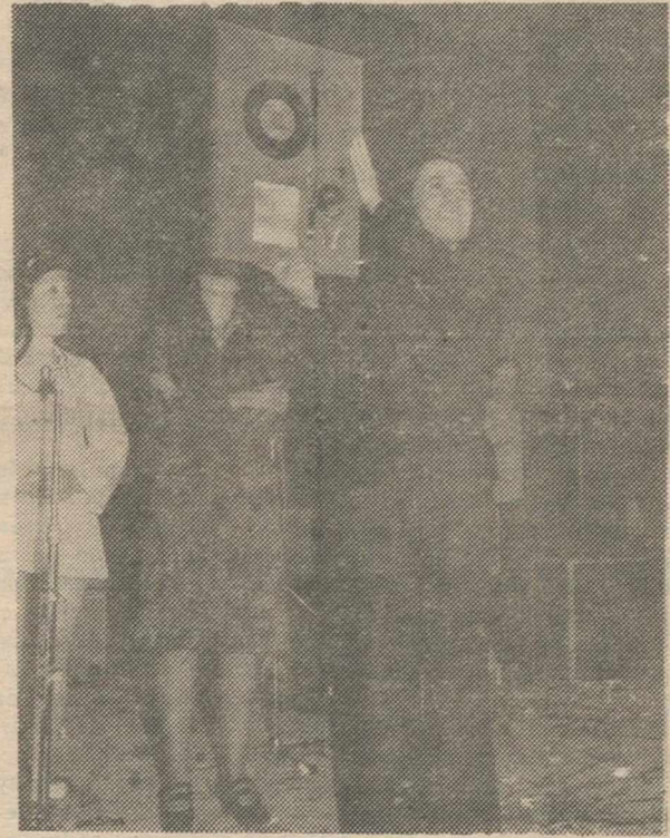
BARCELONA. El popular cantante Raphael, muestra la placa acreditativa del premio "Olé de la canción", que ha recibido por el conjunto de su labor como cantante en el transcurso del pasado año.