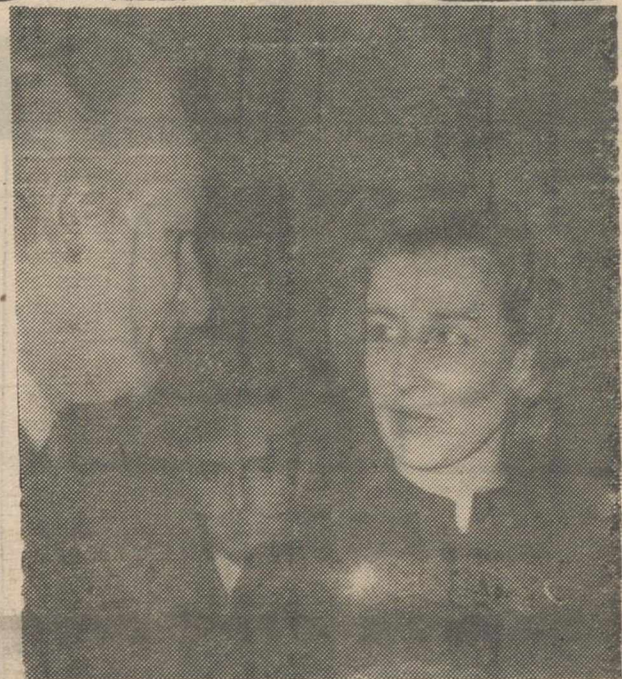
LONDRES.—La princesa Alejandra, conversa con el embajador de Francia en Londres, Geoffrey de Courcel, durante la apertura de una exposición de pinturas venecianas del siglo XVIII en la Galería Heim, de Londres. (Telefoto CIFRA GRAFICA-UPI).