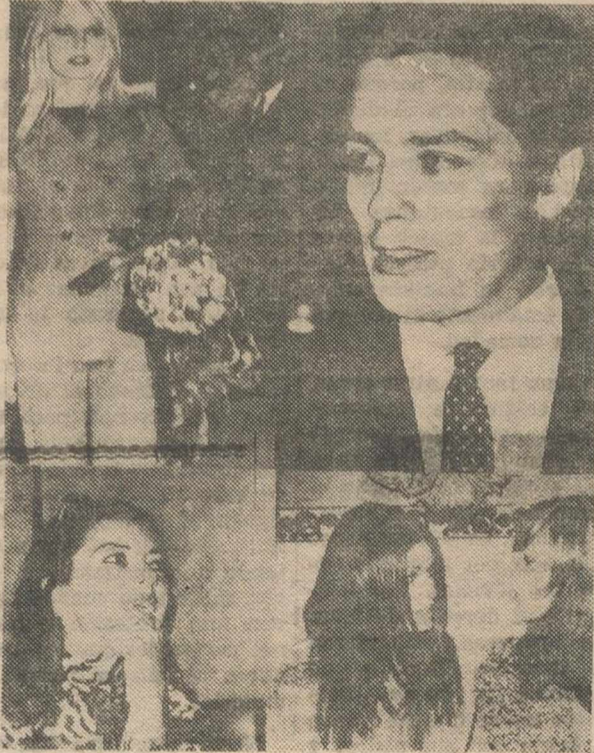
De arriba a abajo y de izquierda a derecha, Brigitte Bardot, Alain Delon, Giovana Ralli y Marisa Mell, con Marisol.

Y no hay que olvidarse del tándem Sara Montiel-Bardem, que dio más que hablar a través de «Varietés», que iba a ser el no va más de Saritísima y que a lo mejor lo ha sido o, a lo peor, no. Más lejos, allá por Las Vegas, Olivia Hussey (ex Julietta de Zeffirelli) se casó con Dino Martín, hijo