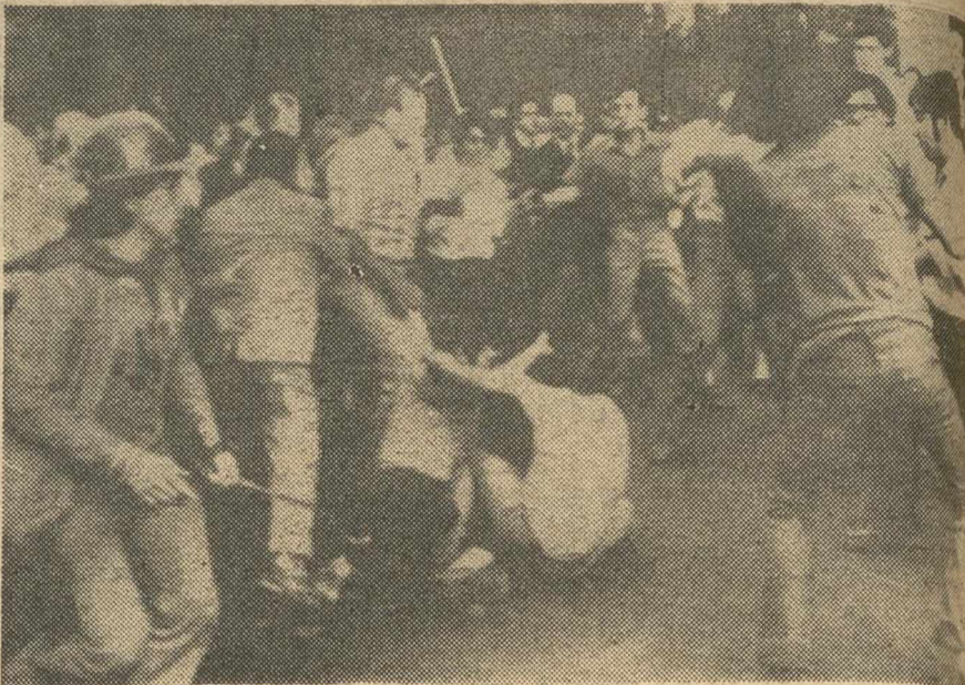
SANTIAGO DE CHILE.—Una verdadera batalla campal, entre seguidores y oponentes del Gobierno de Salvador Allende. Un manifestante, primer plano, armado con una cadena de bicicleta, aparece dispuesto a intervenir.