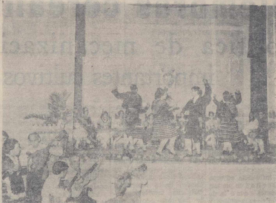
Un momento de la actuación de Coros y Danzas de Almansa, en la Fiesta de Exaltación de Murcia-Albacete, en Valencia.