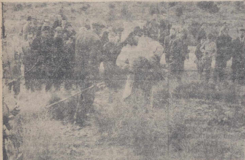
Un momento de la cogida del esparto, durante el Concurso de Destreza en este oficio, celebrado en Hellín, el domingo.

Jerarquías provinciales e invitados de honor hicieron entrega de los premios a los vencedores de la competición que por primera vez se celebró en España