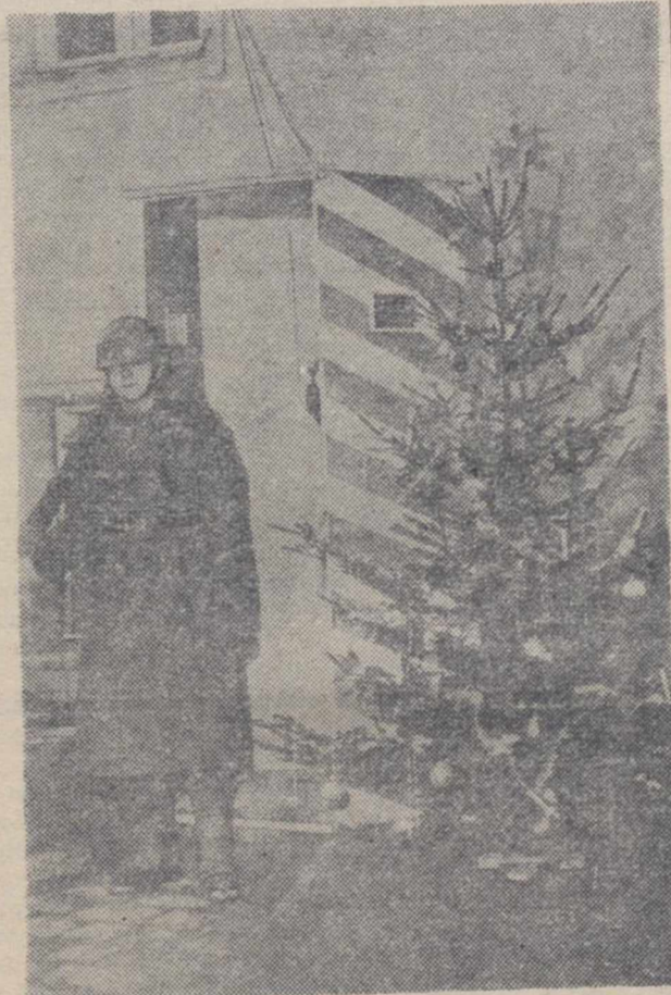
La Navidad del soldado, una de las más dramáticas. En estos días de paz y de amor, han de permanecer en sus puestos, precisamente para mantenerlos.

A las 8 de la mañana de aquel día, el silencio invernal sobre el aeropuerto de Eindhoven, en Holanda, fue violentamente