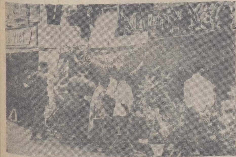
SAIGÓN.—Paisanos survietnamitas y soldados norteamericanos, adquieren los tradicionales árboles de Navidad y otros adornos navideños, en el mercado de flores de Saigón. La guerra y el terror no han podido con la tradición cristiana de estos días.