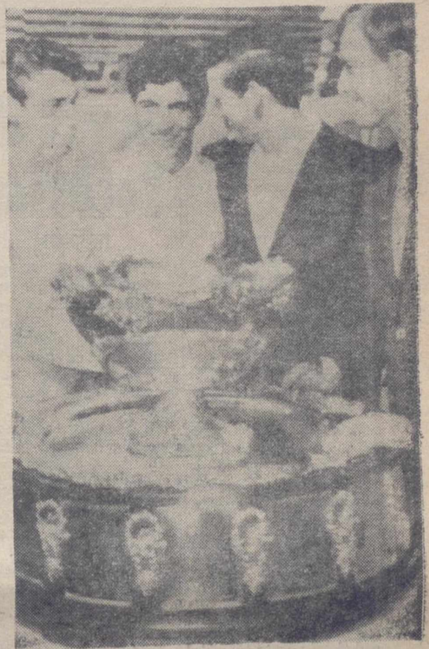
BRISBANE.—Los españoles Manuel Santana y Manuel Orantes, con los australianos Emerson y Newcombe, junto a la famosa «ensaladera», después del sorteo de partidos.

(Amplia información del encuentro de dobles de esta madrugada y declaraciones de los capitanes y jugadores en la página DOCE)