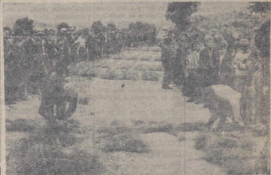
Son ahora los "atadores" los que vemos actuar al final del Concurso de Destreza.