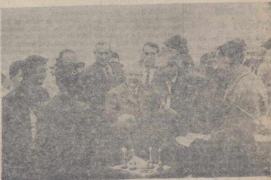
Otro momento de la entrega de premios a los vencedores del Concurso.