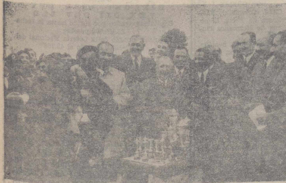
El vencedor absoluto del Concurso de Destreza en el Oficio de Cogedores de Esparto, mostrando, alegre, el magnífico trofeo conseguido.