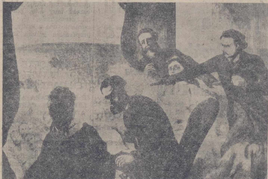
Según el biógrafo del presidente de los Estados Unidos, Abraham Lincoln, éste tuvo un sueño en el que se vio muerto en la Casa Blanca. Poco después era asesinado por un fanático. Este grabado recoge el momento de su asesinato. (FOTO FIEL)

► Un proceso ganado gracias a un sueño oportuno