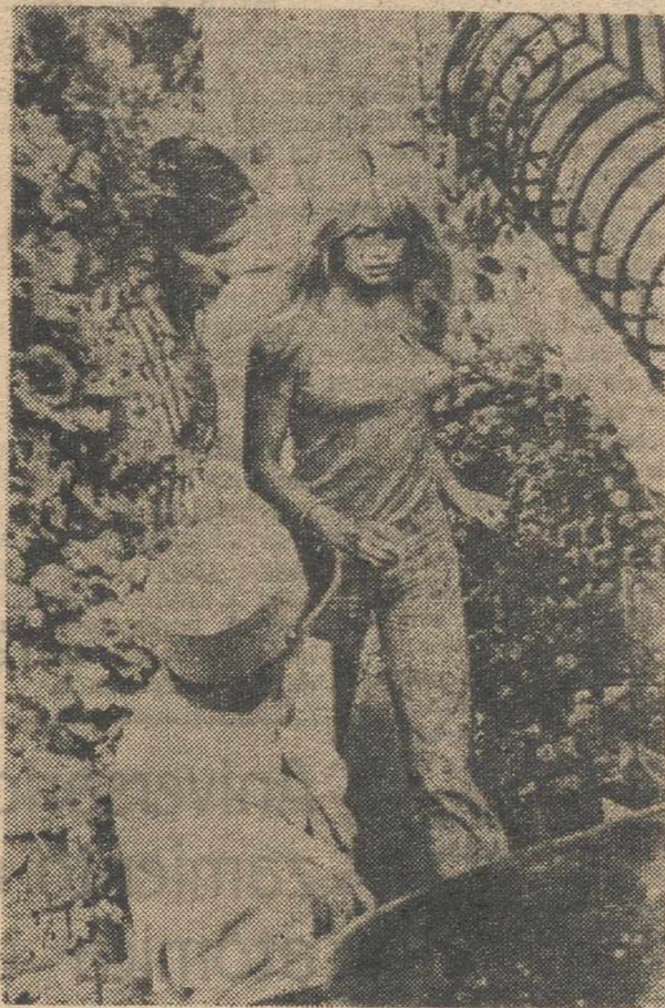
Brigitte Bardot y Gunther Sachs, salen de la finca que poseen en Port de Pully (Suiza), donde están pasando unas vacaciones.

B. B. ha encontrado puntos comunes entre Gunther y Vadim, quien es también, me dice, "un tipo formidable". En su boca no es esta una expresión estereotipada. Corresponde a una idea más precisa de su tipo de