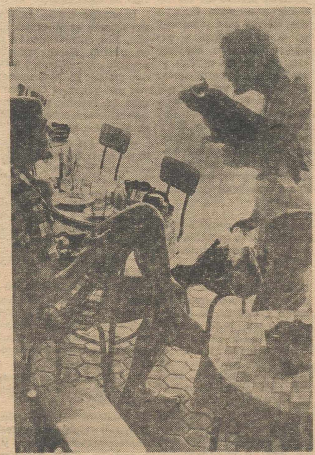
SEVILLA.—Los turistas se pasean por Sevilla bien ligeritos de ropa, para mitigar el calor de cuarenta grados que se deja sentir. Aquí vemos a un vendedor de toritos ofreciendo un Miura a un turista sentado en una terraza.