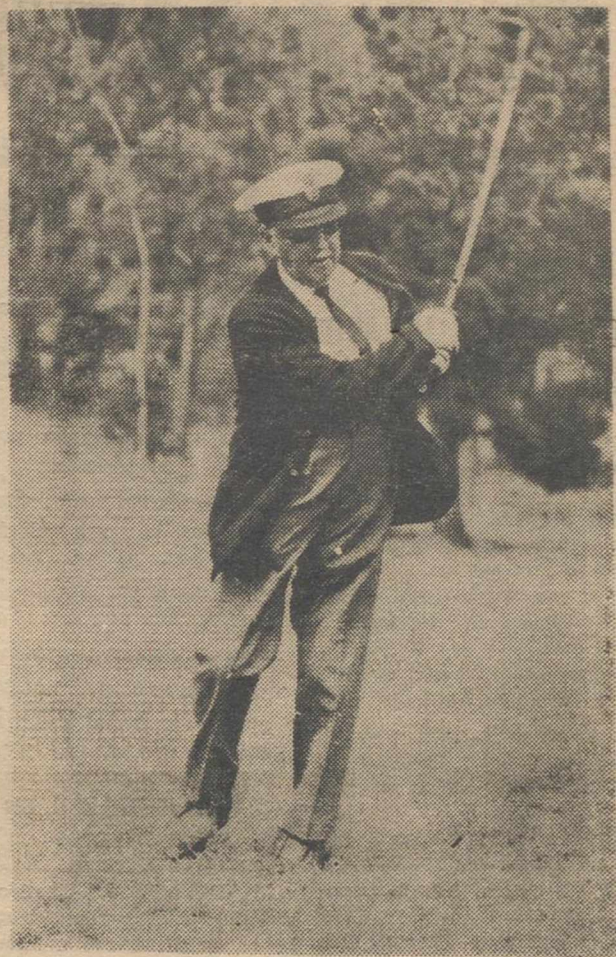
LA CORUÑA.—El Jefe del Estado, con gorra marinera, jugando al golf; durante sus días de descanso en las cercanías de La Coruña.