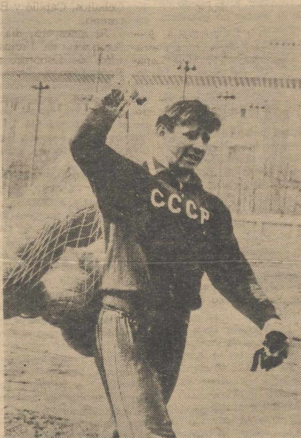
El mundialmente famoso portero de la Selección rusa de fútbol, Lev Yachin, un hombre tan amante del hogar, como del deporte que le dio fama