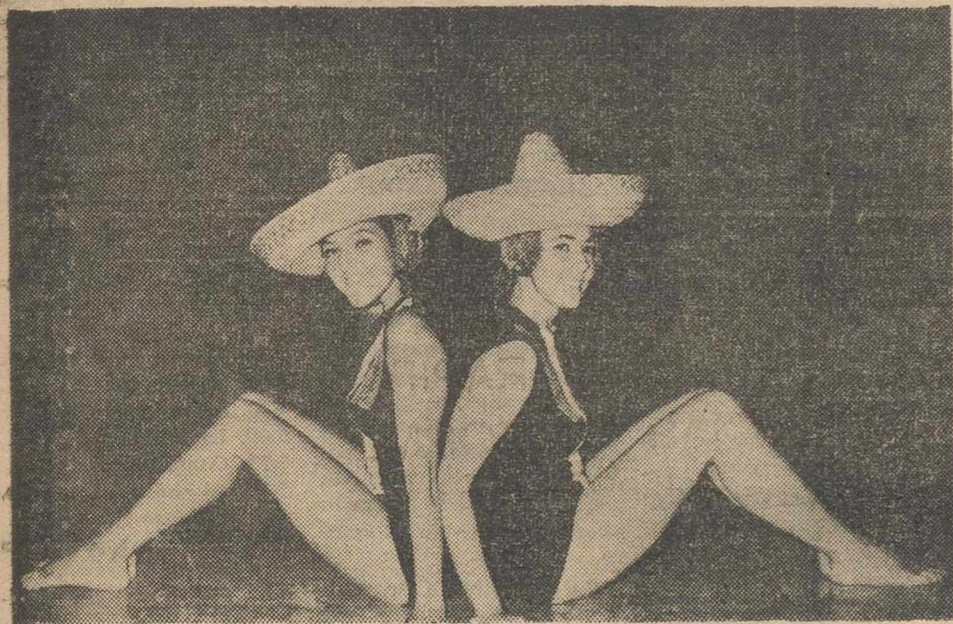
"El jarape mexicano", uno de los números del ballet acuático.

Son muchas las jóvenes que comienzan, atraídas por la facilidad de los primeros pasos, pero pocas llegan al final.—En el agua se puede interpretar desde música sinfónica a los últimos ritmos "ye-yés"