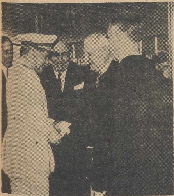
El vicepresidente del Gobierno español, capitán general Muñoz Grandes, conversa con el jefe del Gobierno portugués, Oliveira Salazar, en el acto de inauguración del gran puente sobre el Tajo, que lleva el nombre del ilustre estadista portugués.