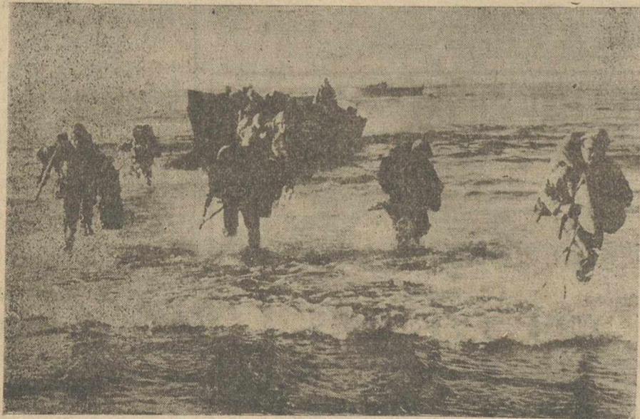
Cincuenta mil marineros y “marines” de los Estados Unidos, transportados en ochenta buques de la Flota del Atlántico y transportes, con catorce barcos de guerra españoles y otras unidades de tierra y aire, han participado en la “Operación Steel Fike I”, en las costas de Huelva, el mayor asalto anfibia en tiempo de paz. En la foto, los “marines” desembarcando a la carrera en la playa de Mazagón.