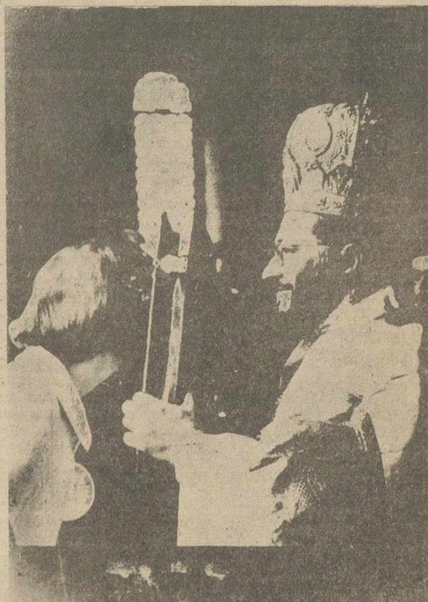
La reina Ana María de Grecia besa con veneración los Santos Evangelios en la Catedral de Kavalla, en el curso de su gira con el rey Constantino por el país, para conocer a sus nuevos súbditos. La joven soberana lo primero que hace al llegar a una localidad es visitar la iglesia.

MADRID, 27.—Fuentes diplomáticas españolas—dice el Banco Exterior de España—han anunciado que antes de que termine el mes en curso, se celebrará una primera reunión entre representantes españoles y funcionarios del Mercado Común. Ha sido encargado de dirigir las conversaciones con los funcionarios del Mercado Común el embajador español, señor Núñez Iglesias. Esta primera reunión está proyectada para establecer un programa de trabajo y un procedimiento para ulteriores conversaciones. —Cifra.