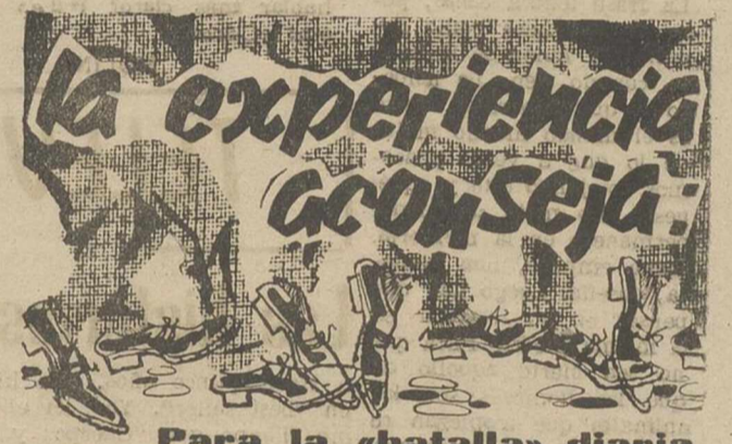
Para la «batalla» diaria

La Dirección de Estadística Federal informaba recientemente que habrá justo ciento catorce millones cuatrocientos mil hombres y mujeres en edad de votar para la jornada electoral del mes que viene; pero agregaba que varios millones no estarán calificados para ello, porque no se inscribieron a tiempo o en razón de que no cumplieron los requisitos legales de residencia en cualquier Estado de la Unión o a consecuencia de no haber alcanzado el nivel requerido por las disposiciones vigentes para ser considerados alfabetizados, después de haber sido sometidos a las pruebas correspondientes.—Efe.