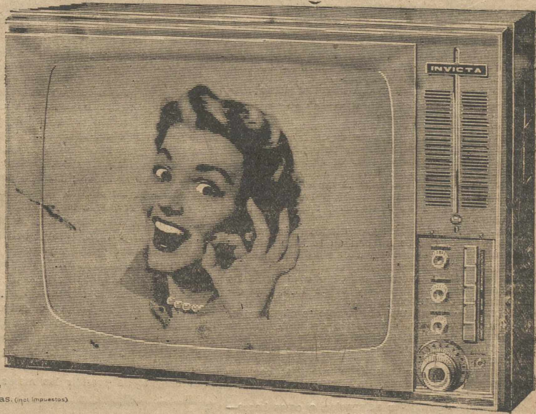
Modelo 1017-23" P.V.P. 22.500 ptas. (incl. impuestos)