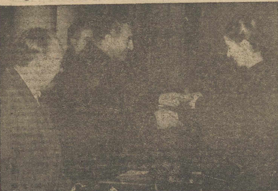
Entrega del Título profesional a una maestra, por el Excmo. señor gobernador civil.