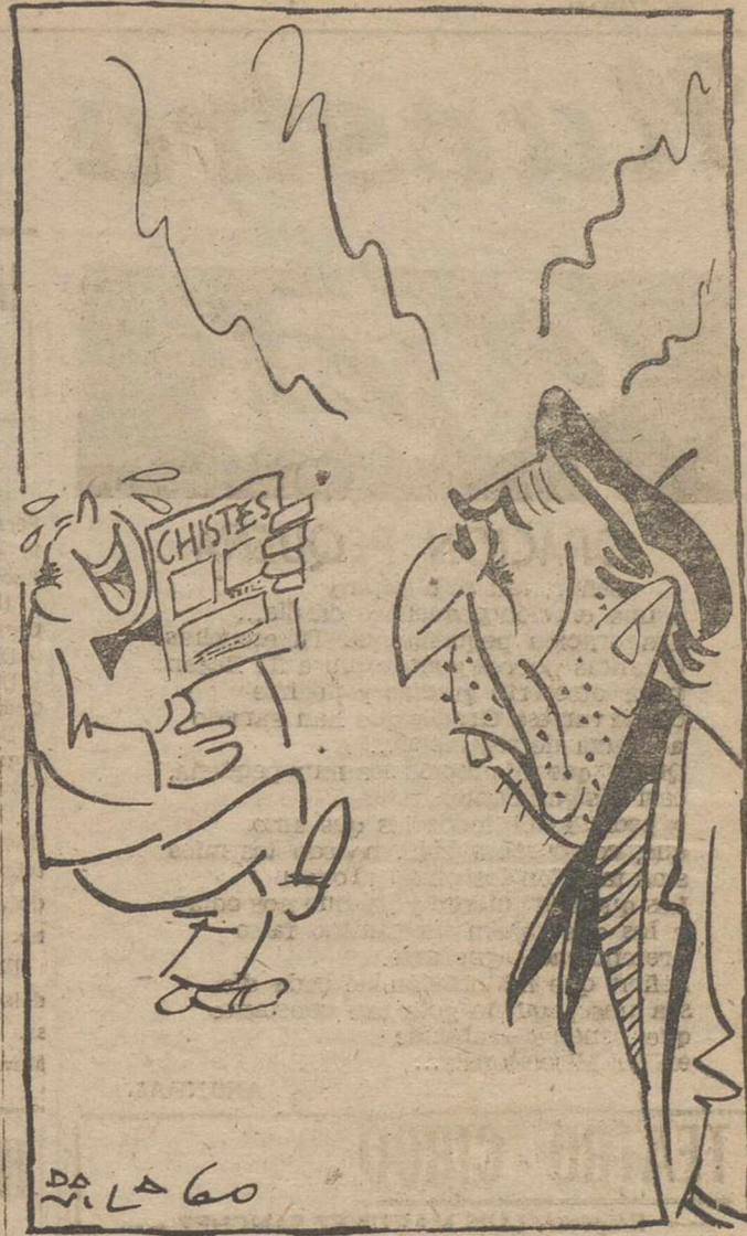
El analfabeto sentirá alguna vez envidia