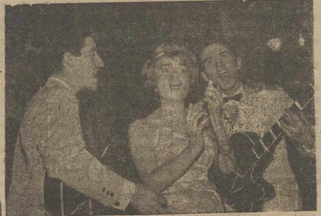
El trío "Los Carinos", que alcanzó un señalado triunfo en su actuación en Villarrobledo.

En el IV número preside la pintura en España.