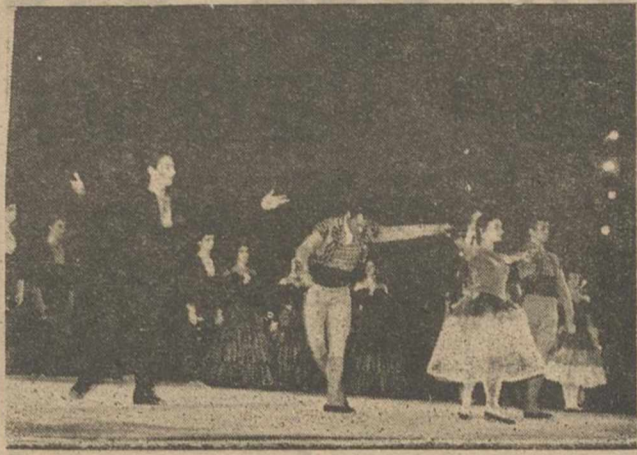
Dos notas gráficas de la triunfal actuación del Ballet Español de Antonio, anoche en el Parque de los Mártires.

Ya relatamos a ustedes la brillante iniciación de los IV Festivales de España en nuestra Feria de 1960, con la actuación del Ballet Español de Antonio. Anoche, esta brillante apertura de los Festivales alcanzó caracteres sensacionales, traduciéndose en un triunfo personalísimo del incomparable bailarín Antonio.