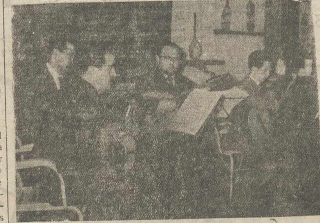
En la parte musical del acto, intervino con brillantez el Quinteto Típico de Cuerda, que dirige el profesor Goig.

MADRID, 7.—Se autoriza al Ayuntamiento de Cuenca para captar 125 litros de agua por segundo del río Júcar y con destino al abastecimiento de aguas de la población. El presupuesto de las obras asciende a 1.145.568'43 pesetas. Las obras deberán comenzar dentro del plazo de tres meses, contado a partir de la fecha. Cifra.