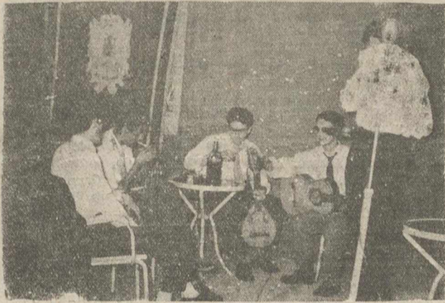
El T.E.U. de Albacete que actuó con gran éxito en el acto celebrado en Villarrobledo, a que se refiere esta información.

Destacada actuación del T.E.U. y del quinteto típico de cuerda