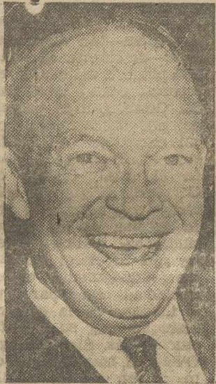
LA «ERA DE LA CONQUISTA DEL ESPACIO»

por el presidente se prevé la construcción de tres submarinos, especiales destinados a transportar proyectiles dirigidos, una fragata propulsada por energía nuclear; destructores con plataformas para proyectiles dirigidos, al proyectil balístico intercontinental conocido por «Atlas», tres proyectiles balísticos de radio de acciones, intermedio, conocido por «Thor», «Júpiter» y «Plaris», este último para ser lanzado desde submarinos y también para proyectiles dirigidos, para contrarrestar la acción de otros proyectiles, un sistema especial para detectar la presencia de proyectiles balísticos y un programa de investigación sobre satélites y naves del espacio.