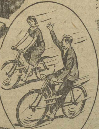
La bicicleta que todo el mundo desea... Orbea

CADA SOBRESALIENTE puede convertirse en una BICICLETA Orbea