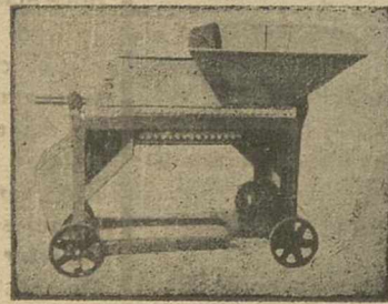
Rendimiento 6 ó 9 fanegas hora