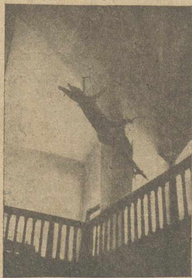
El «lagarto» del Viso, colgado, expiando así su vida nada ejemplar, taimada y proterva