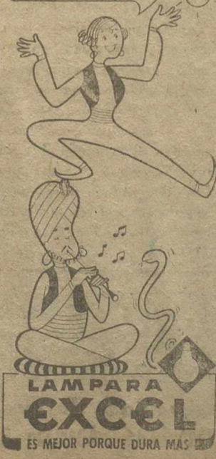
ES MEJOR PORQUE DURA MAS