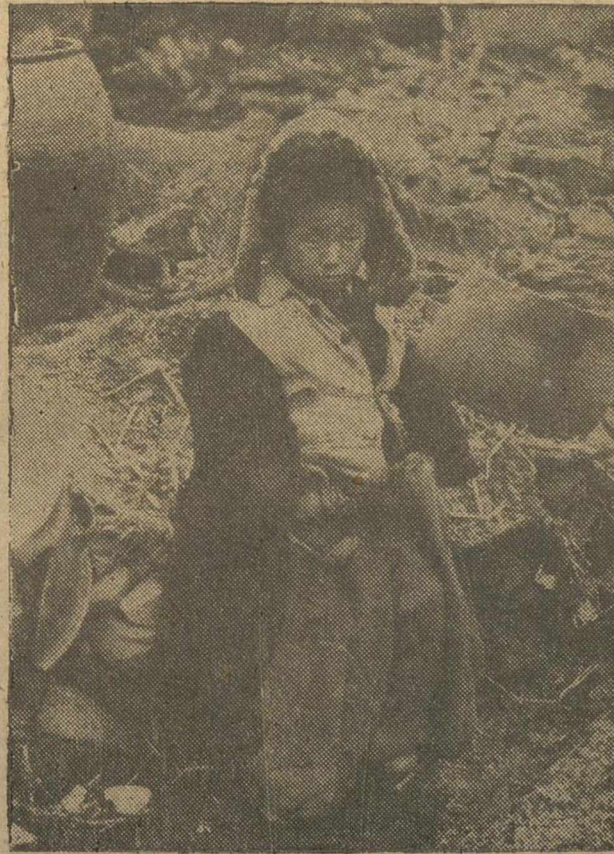
Sola y sin techo que la cobije, esta niña a la que la guerra de Corea ha dejado huérfana, ha sido sorprendida por la cámara fotográfica sentada entre escombros cerca del frente de batalla, después de perder unos días antes a sus padres durante un combate.