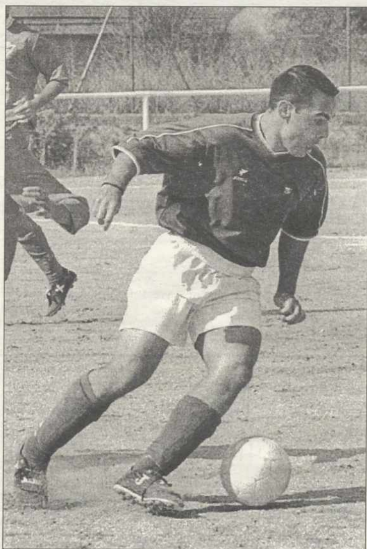
El Toledo B nunca no cedió la posesión del balón al Valdepeñas