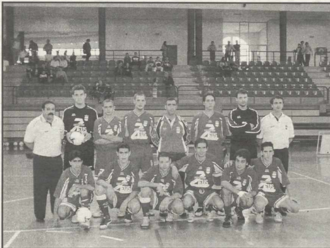
La plantilla del Puertollano Fútbol Sala