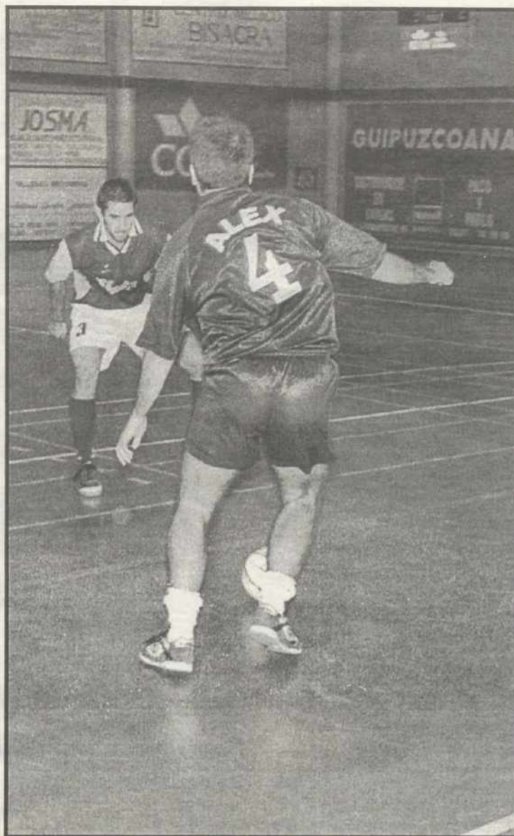
El Ocaña consiguió una victoria muy importante

"Jóvenes, aunque suficientemente experimentados". Gonzá-