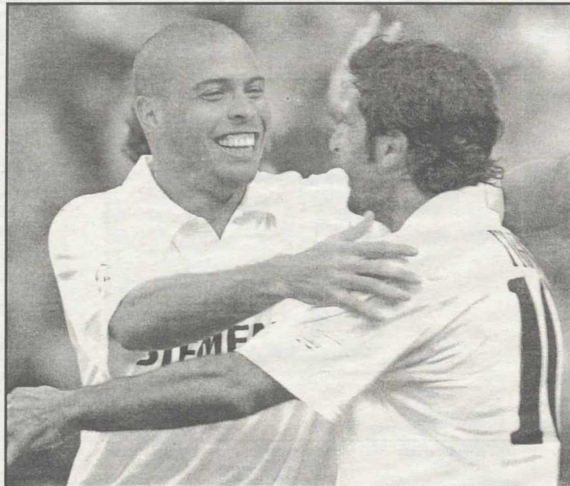
Figo y Ronaldo, autores de dos goles cada uno, se abrazan en el partido de ayer