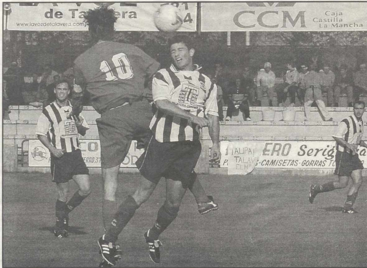
El Talavera brindó ayer un buen espectáculo a una afición muy necesitada de celebrar goles