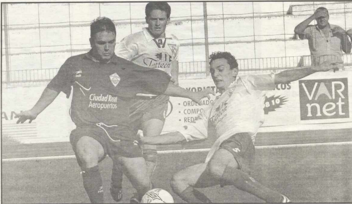
Imagen de un partido del Manchego