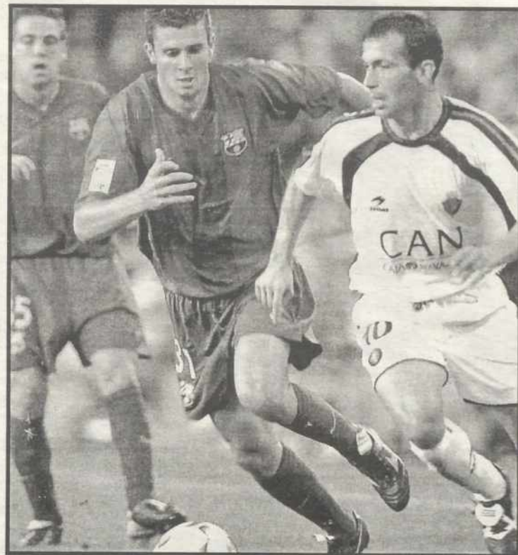
El Barcelona no pudo hacer más

Van Gaal escuchó los primeros abucheos, aunque no generalizados, a la conclusión del partido y en algunos lances aislados, como la incomprensible sustitución de Javier Saviola por Gerard