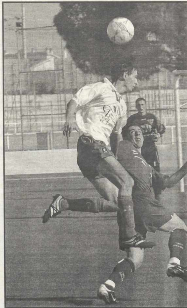
El Manchego rindió por debajo de sus posibilidades

El Manchego, con este juego, será un equipo ficticio, y el Bolañego casi con toda seguridad un candidato al descenso.