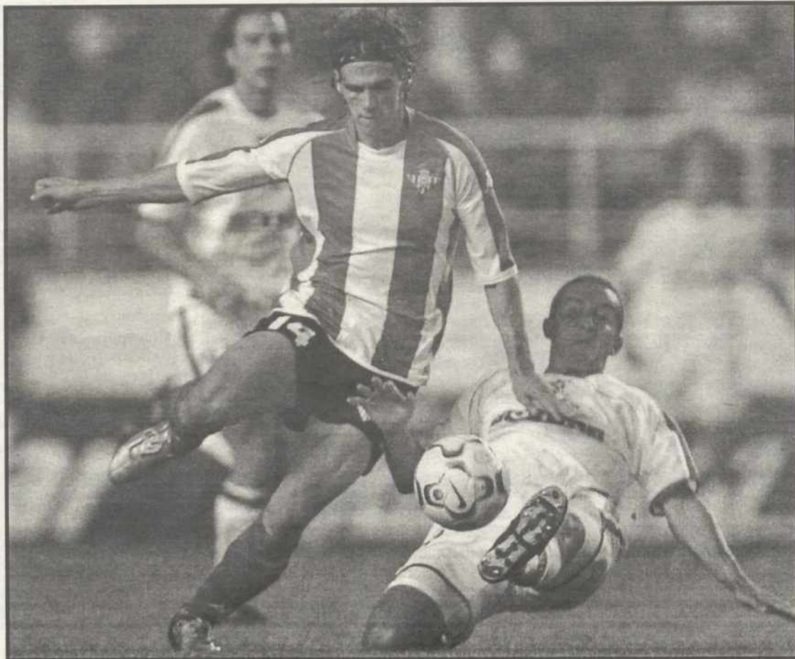
Capi salva la entrada de Samways durante el 'derbi' de ayer

El dominio y el explosivo arranque del Betis le dio sus frutos frente a un Sevilla que perdía balones ante la presión y poderío de Ito y Assuncao, pues Joaquín hizo el 0-1 en el minuto 18, marcó el 0-1 al cabecear un pase de Denilson tras perder un balón Gallardo. El Betis fue muy superior gran parte de esta mitad a su rival, pero el Sevilla, con Gallardo como su hombre más vertical y activo