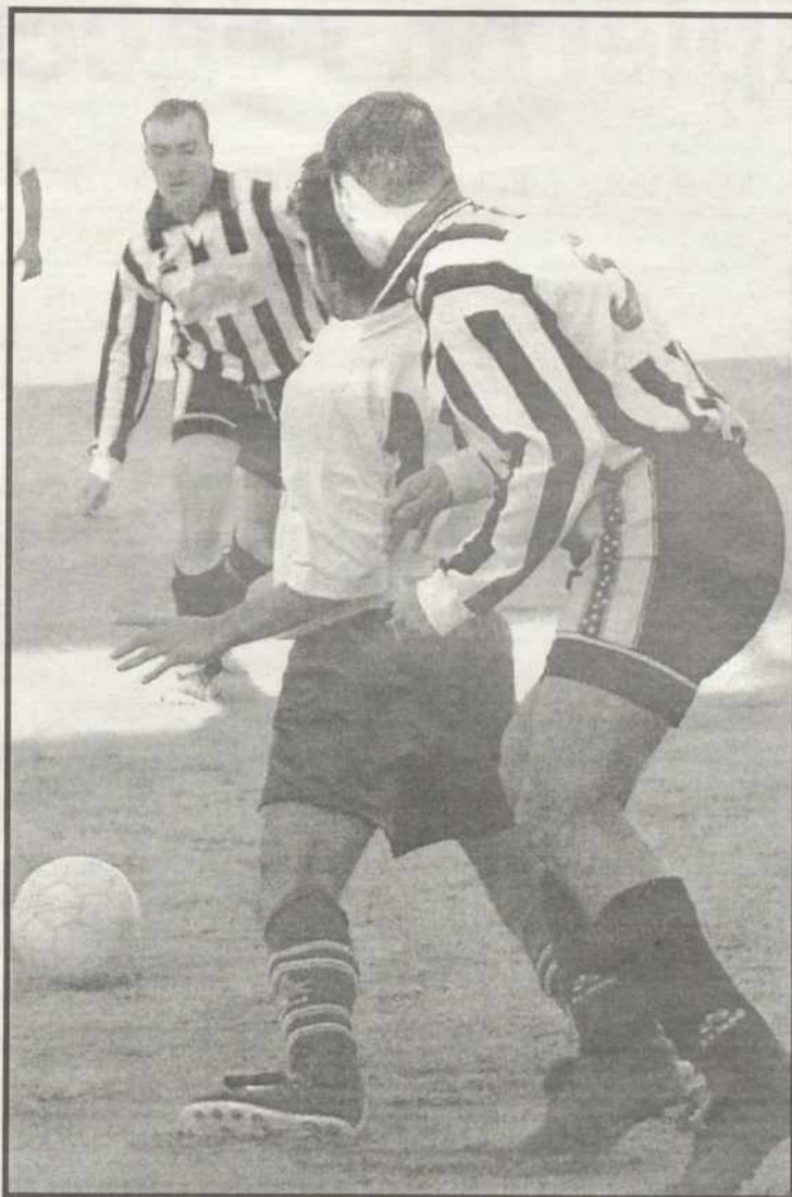
El Criptanense no fue capaz de hacer un sólo tanto