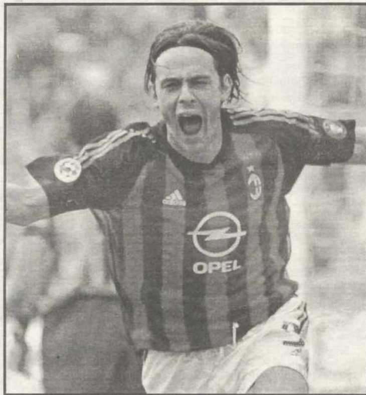
"Pippo" Inzaghi logró tres goles

La 'Vecchia Signora' redobló esfuerzos en busca de la igualada, pero el triunfo del Como se veía muy cercano ya que los ataques locales seguían sin orden. Pero, para fortuna juventina, el