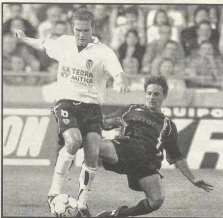
Baraja y Jesuli en una jugada del partido de ayer

• VALENCIA: Cañizares, Curro Torres, Aya-la (Marchena, m. 59), Pellegrino, Carboni, Albelda, Baraja, Rufete, Aimar (Sánchez, m.84), Vicente y Carew (Mista, m. 65). • CELTA: Cavallero, Velasco (Coudet, m. 82), Cáceres, Berizzo, Silvinho, Vagner, Giovanella (José Ignacio, m. 59), Luccin, Jesuli (Edu, m. 62), Mostovoi y Catanha. • ÁRBITRO: Rodríguez Santiago (colegio castellano-leonés). Amonestó por el Valencia a Cañizares, Carboni y Baraja, y por el Celta a Mostovoi, Catanha, Vagner, Velasco, Cáceres, Luccin, al entrenador Miguel Angel Lotina y a uno de los integrantes del banquillo. • GOLES: 0-1, m. 90: Vagner • INCIDENCIAS: Partido correspondiente a la