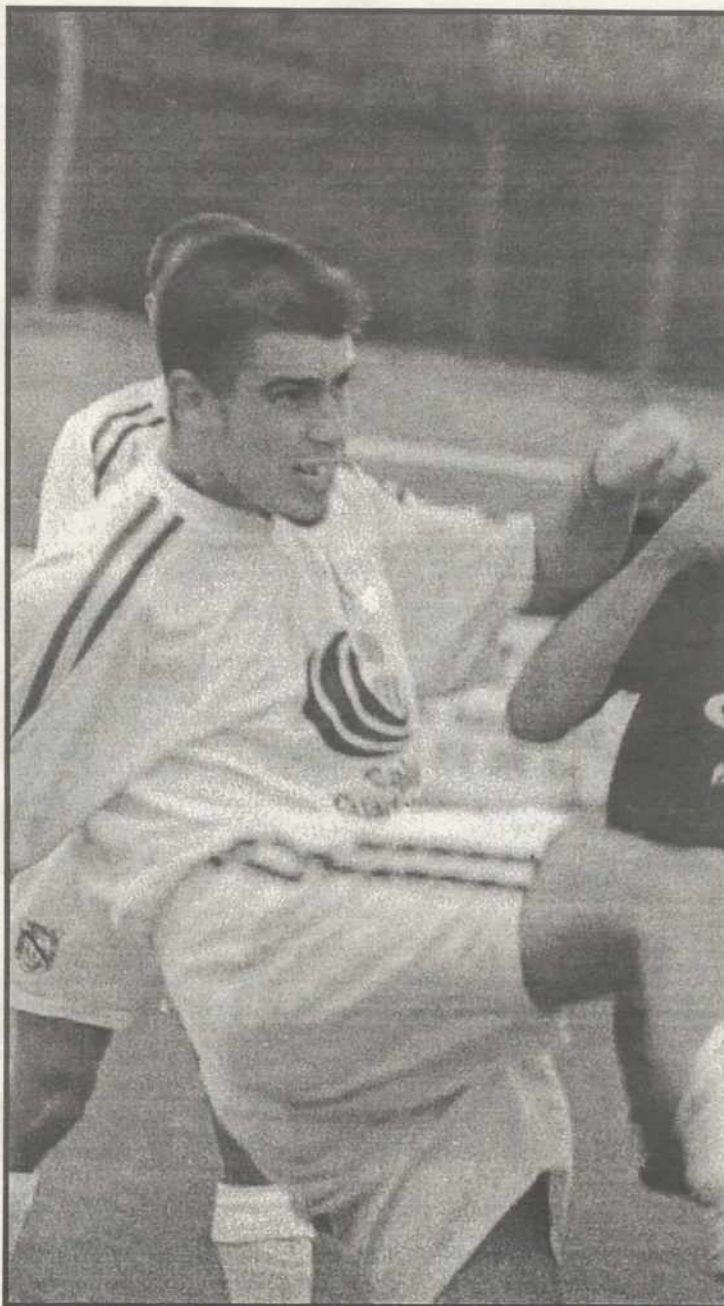
El Cabanillas no obtuvo la victoria y perdió el liderato