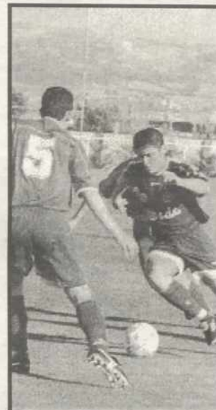
Marchamalo no pudo ganar

El entrenador del Cabanillas se mostró satisfecho por el esfuerzo realizado por sus jugadores y a pesar de la derrota