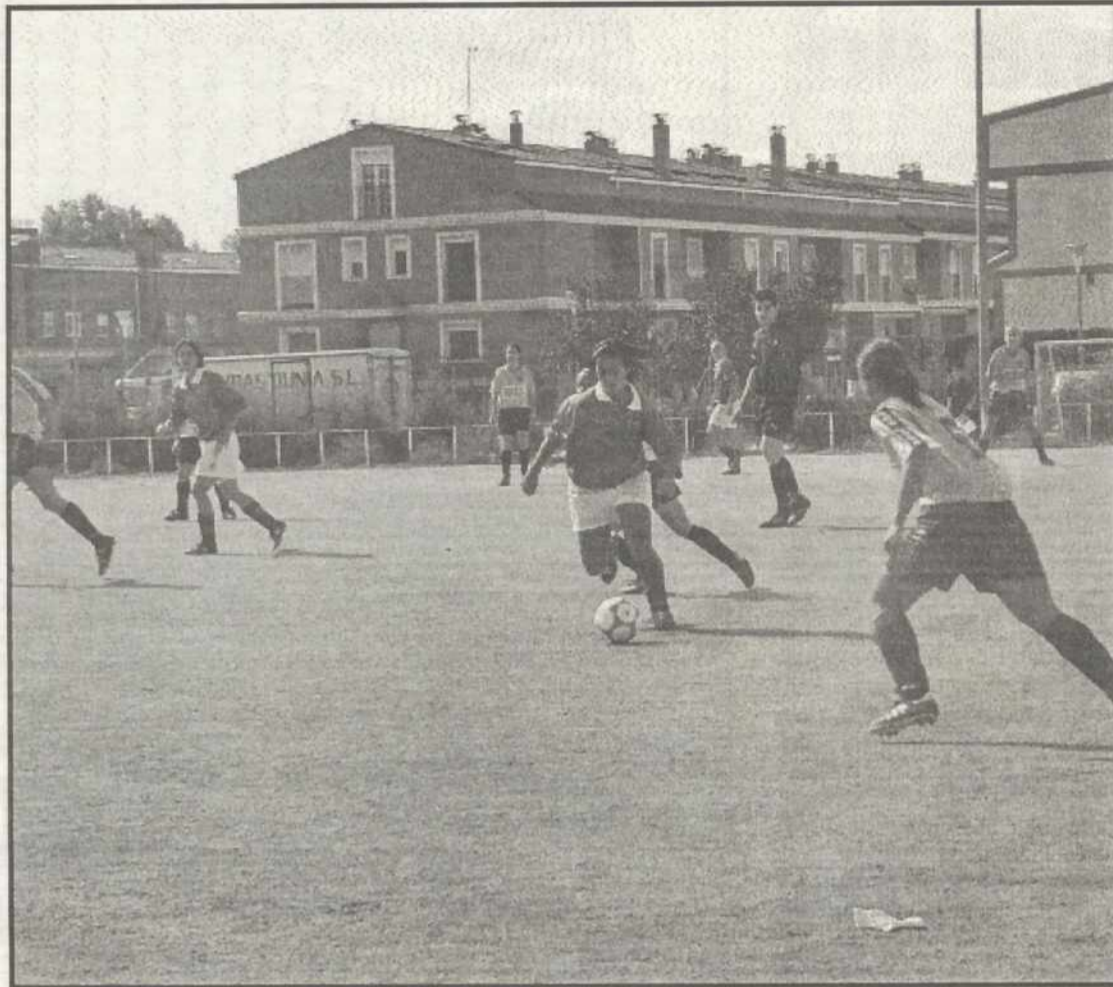
Dos errores puntuales decantaron el partido a favor del conjunto visitante

El segundo gol vino tras una parada de la portera local, que no pudo atajar el balón; este quedó suelto y en su bote se introdujo en la portería. A partir de ahí, y a pesar de que aún quedaba tiempo para remontar, las chicas que en-