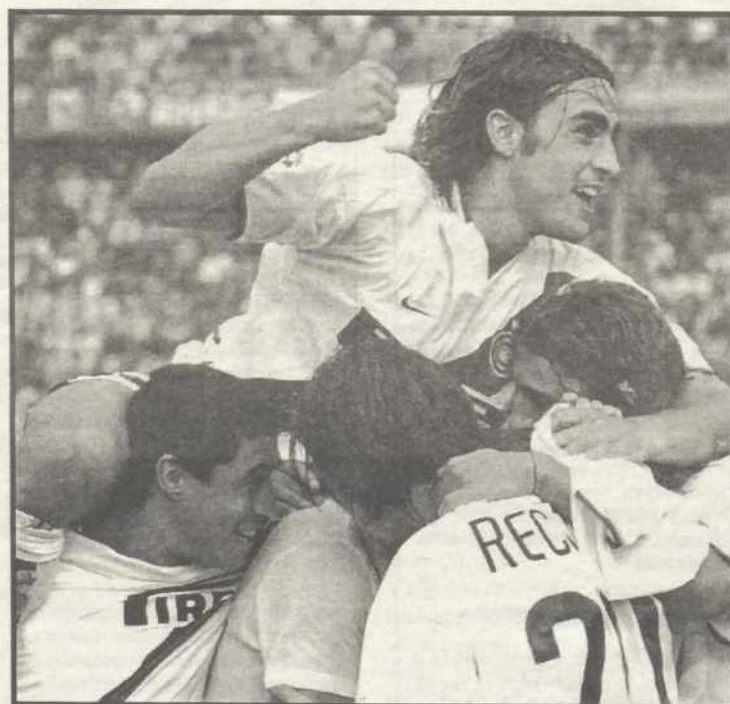
El Inter celebra uno de sus goles

El que sigue aumentando su racha de aciertos ante la meta rival fue Filippo Inzaghi, que llevó al Milán a un concluyente 6-0 casero sobre un Torino a la deriva, colista, sin punto alguno, y que podría registrar cambio de entrenador en los próximos días.