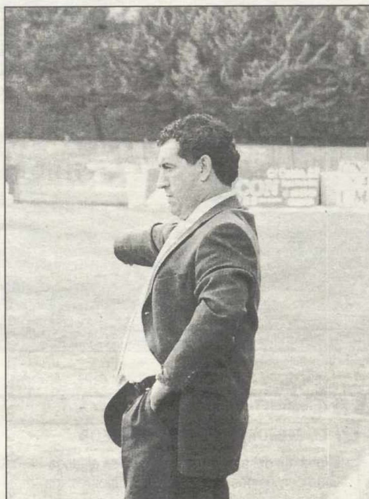
Zurro en el desarrollo del partido

resultado “creo que inmerecidamente” y reconoce que explotó a sus delanteros para crear segundas jugadas.