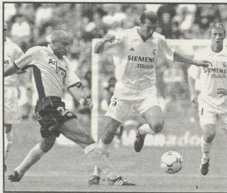
Zidane logró el mejor gol de la tarde

Iván Alonso pudo resarcirse al final de su fallo en el penalti, pero ese gol no le sirve para consolarse él ni su equipo de la oportunidad que tuvo de plantear más problemas a este Real Madrid que agradeció la salida de Ronaldo, aunque no se puede olvidar el gol de bandera de Zidane.