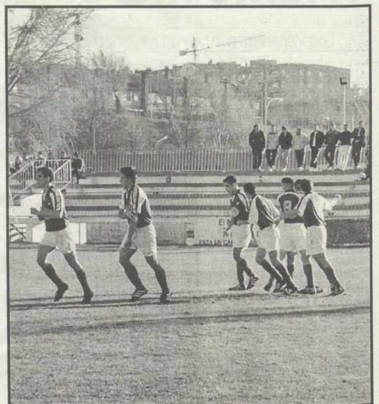
El Guadalajara no pudo puntuar

Una de las mayores dificultades que encontraron los alcarreños fue el estado del terreno de juego. Un campo que además de ser pequeño, es el único de tierra que existe en la categoría de la División de Honor.