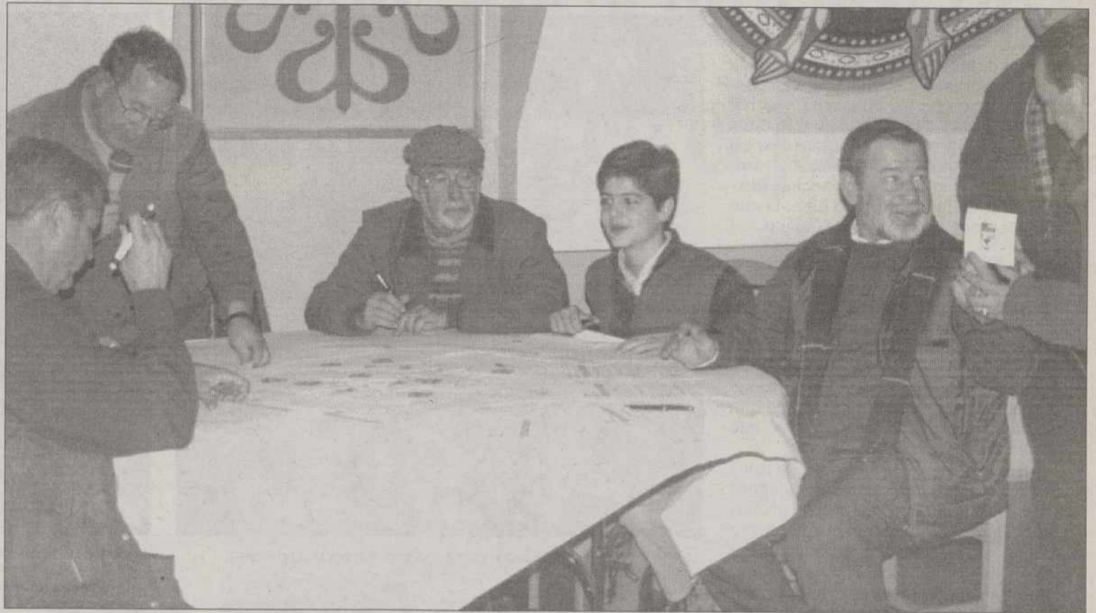
En los Salones de Polín de Piedrabuena, se realizó el sorteo y la comida.

Comentarios sobre la cantidad escasa de reses cobrados, según algunos, nos han llegado a esta redacción, pero la realidad que presencié esta redacción de la Sección de Caza del Diario de LA TRIBUNA, junto a la mayoría que se quedó a ver los resultados, fue la de dieciséis jabalíes cobrados, y una buena