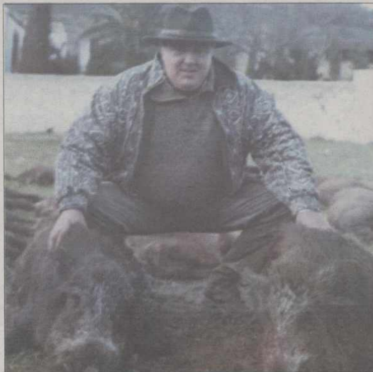
Arriba uno de los agraciados cazadores con dos buenos jabalíes.