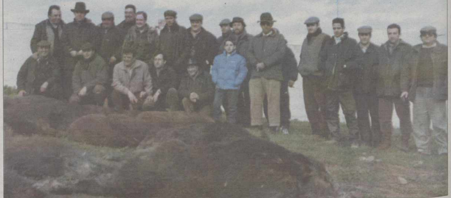
Grupo de cazadores celebrando los buenos resultados de 63 jabalíes cobrados en Navalrosal.

las se dejaron oír por no cortar los buenos lances de los perros con los cochinos terminada la cacería, y las horas cerrando el día, vimos bajar uno a uno los perros extasiados de las locas carreras.