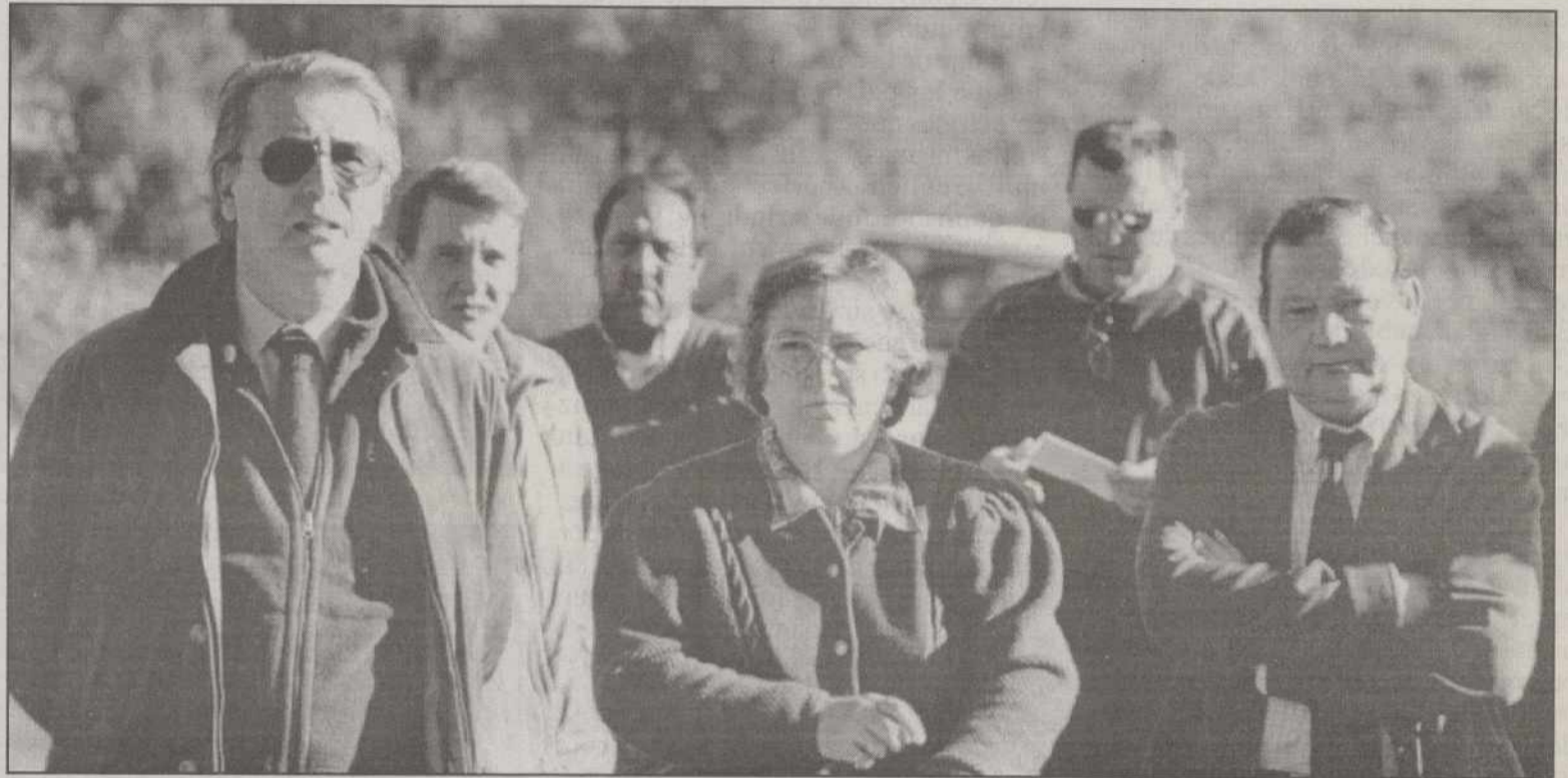
En un collado de Sierra Alta, con los rezos a la Virgen de la Cabeza, comenzó el día de caza.

La calidad de los ciervos de estas sierras no es todavía muy buena, pero con una buena gestión se podrán alcanzar distinguidos trofeos venatorios.