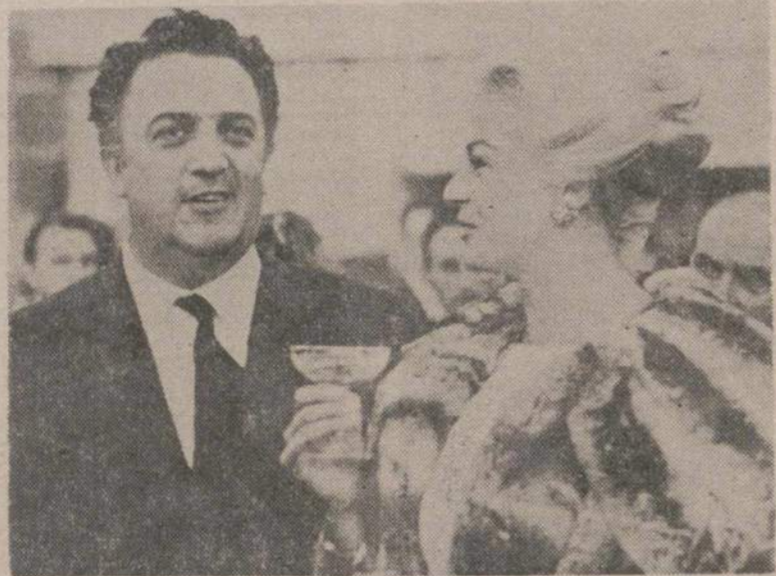
Federico Fellini, la culminación del barroco, y Anita Ekberg, su protagonista en «La dolce vita»

El cine se abre a nuevos temas. Y sueñan sus cañones de la guerra. El cine se encuentra en pleno desarrollo. Y sobreviene la pantalla gigante.