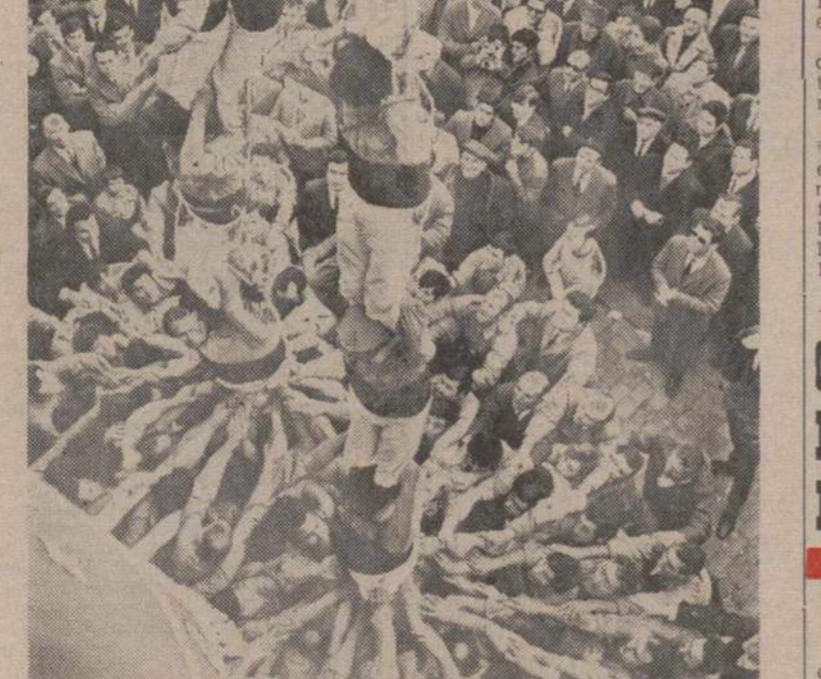
Se han celebrado en la localidad tarraconense de Valls, con gran solemnidad, sus tradicionales Fiestas decenales. El ministro de Comercio, señor Fontana Cobiña, representó al Jefe del Estado en ellas. Miles de personas llenaron la ciudad contemplando con admiración las torres humanas o «castellers» formadas por los fuertes y valerosos hombres de la localidad, famosos en España y en el mundo con el nombre de «Xiquets de Valls». En esta fotografía vemos la espectacular manera de componer las torres humanas.