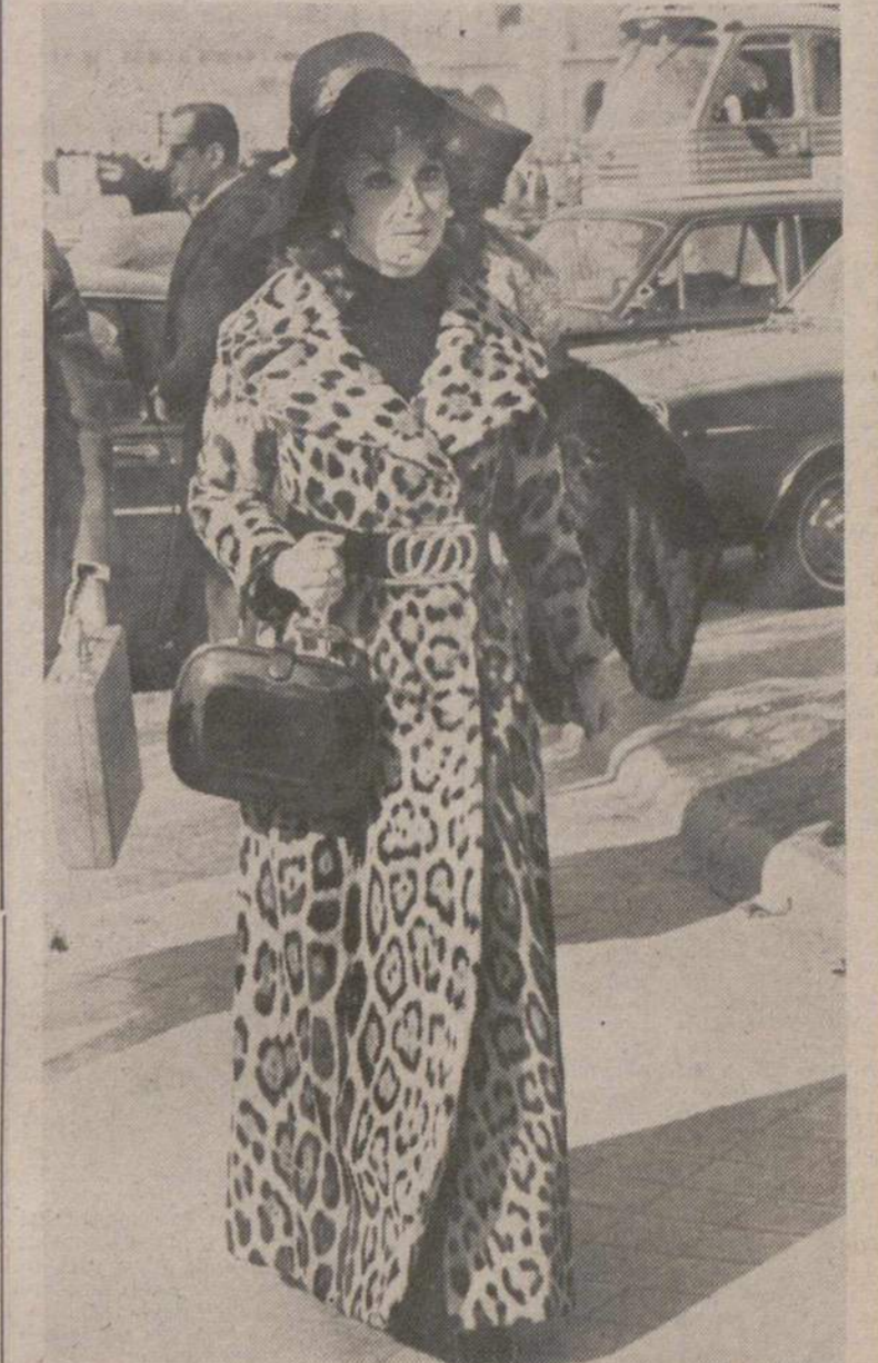
MADRID.—La famosa actriz Gina Lollobrigida en las calles de Madrid. La famosa estrella ha llegado a la capital de España. Rodará una película con el actor Lee Van Cleef.