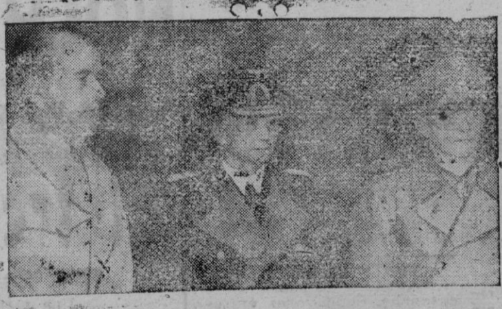
Alberto Speer (izquierda), Ministro de Producción de Hitler, el Almirante Doenitz (centro) y el General Gustav Jodl, que figuran en la primera lista de criminales de guerra.