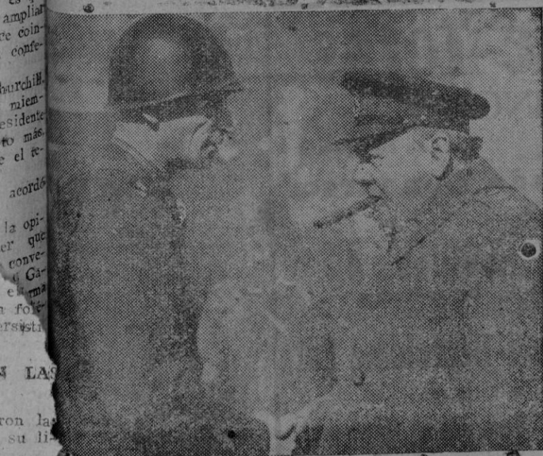
El primer Ministro inglés, saludando al general Simpson, una de las más recientes fotografías de Churchill