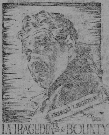
LA TRAGEDIA de la BOUNTY