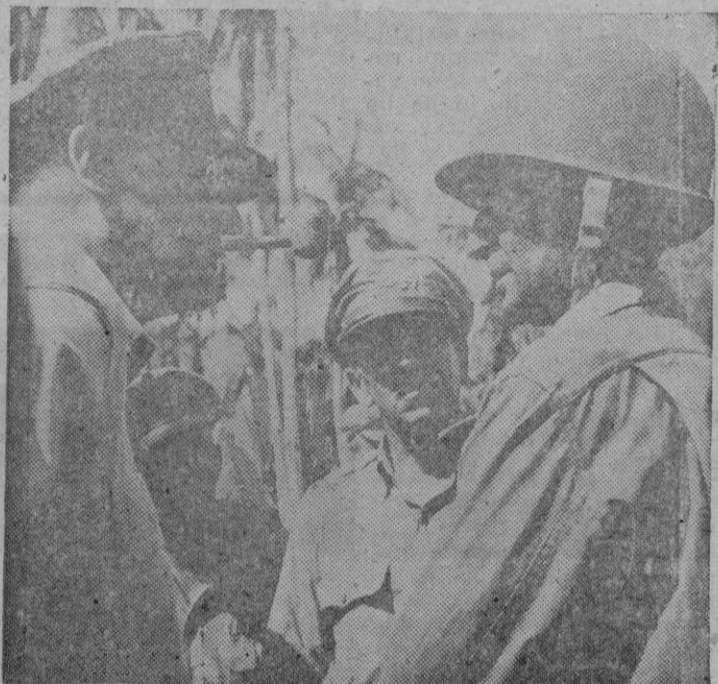
El general Mac Arthur trata de cuestiones estratégicas de la campaña de Filipinas con el general de División Frederick A. Irvin (derecha), jefe de la 24.ª División de Infantería, cerca de Tacloban, capital liberada de la Isla de Leyte