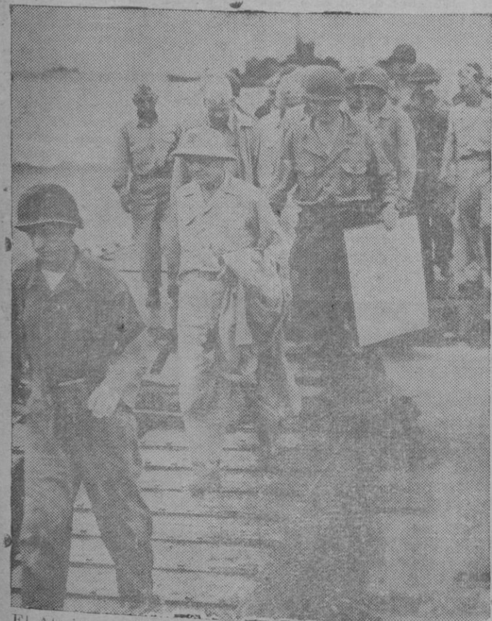
El Almirante William F. Halsey, Jefe de la Tercera Flota norteamericana (con el capote al brazo), desciende a tierra en Angaur, la isla más meridional de las Palaos, conquistada