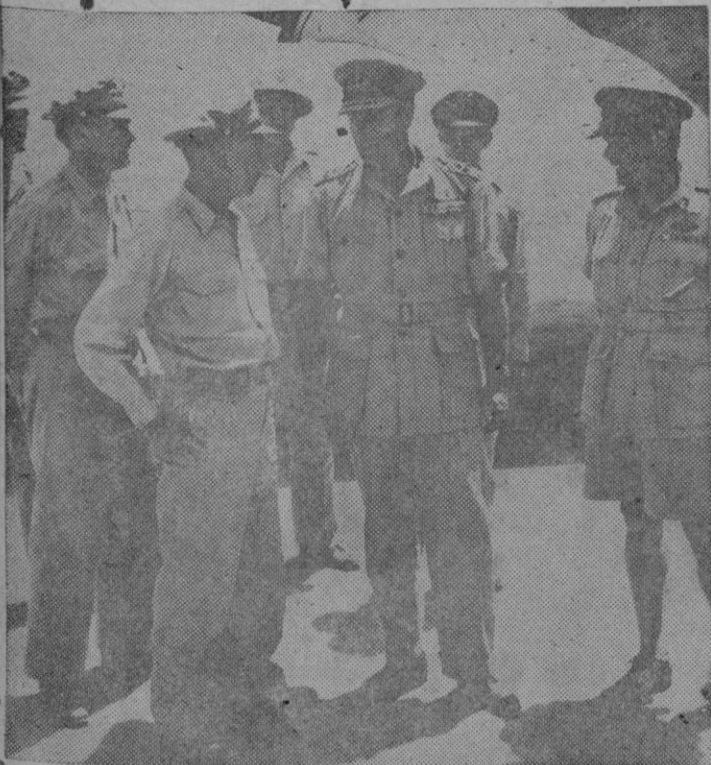
Lord Louis Mountbatten (centro), supremo Jefe aliado en el Sudeste de Asia, con el general de Brigada, Wolfe, jefe del Servicio de bombarderos de la Fuerza Aérea, en una base de superfortalezas en la India.