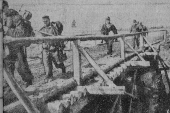
guerra en Sicilia. — El paso por un puente improvisado

Más de 30 personas resultaron muertas y otras muchas heridas.