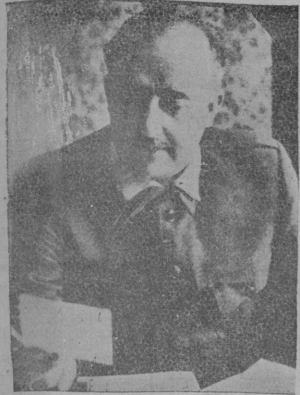
Una de las recientes fotografías del Generalísimo Franco