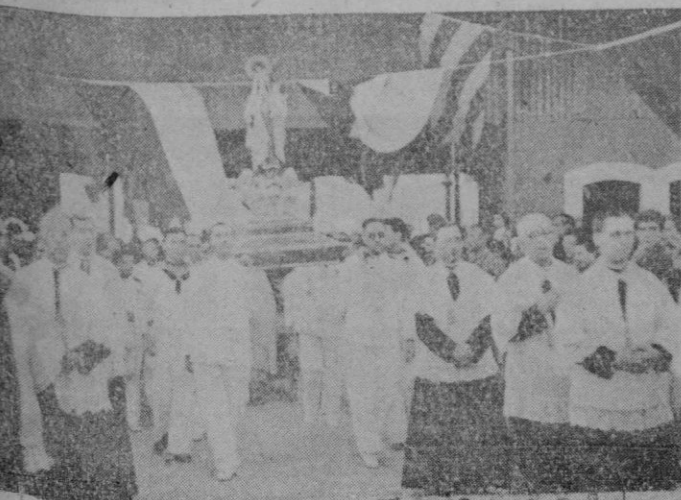
La Virgen del Carmen en la procesión