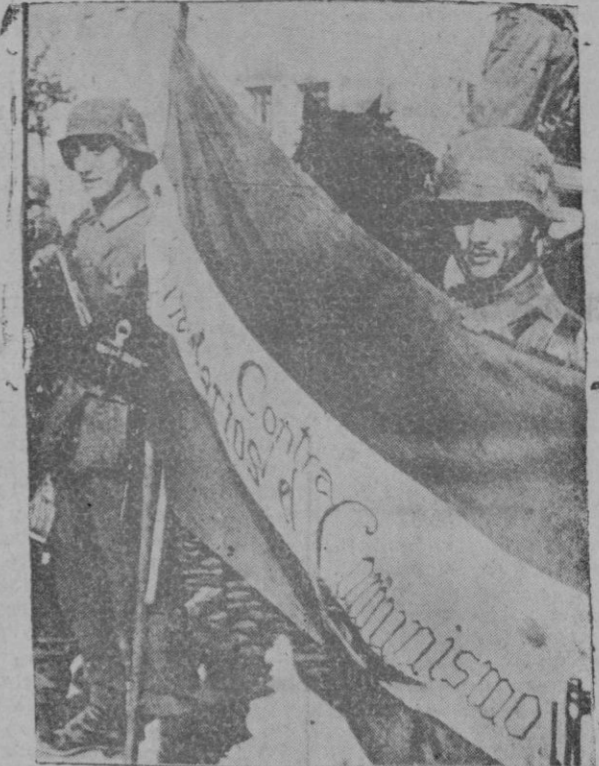
Voluntarios contra el comunismo, grito de la bandera de España en los campos de Rusia, donde se repite la gloriosa gesta de España contra los soviets, iniciada el 18 de Julio de 1936 en las tierras de España

Era ya, a los pocos días, el país entero, galvanizado por los ideales inmarcescibles, celosamente conservados a través de la Historia, el que se había puesto en pie y se entregaba se daba totalmente y sin reservas para el triunfo final. Estaban en juego principios inmortales: la