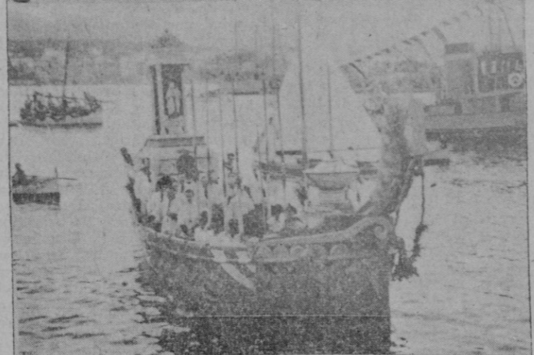
La nave portadora de la Virgen, presidiendo la procesión