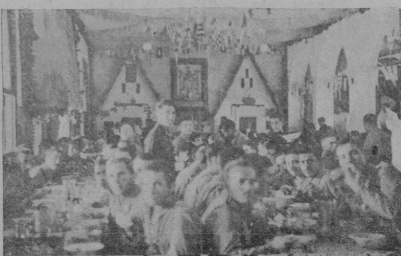
La Infantería de Marina saboreando la comida extraordinaria