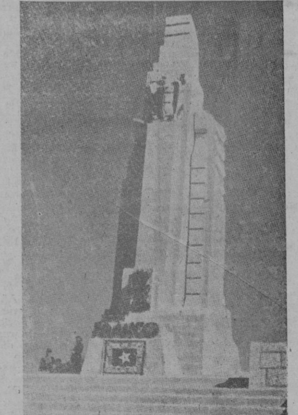
El monumento conmemorativo del 12 de Julio de 1936 inaugurado en el Llano Amarillo. Recuerda la fecha en que cristalizó en el Ejército de Africa el ansia de la salvación de España.

Era el "Pro aris et focis" latino que cobraba nueva actualidad; por el altar y el hogar, que era la Religión, la Patria, la Familia, se llevaba adelante, y con brío, la contienda. El genio ecuménico de España se había puesto de nuevo en pie. Esta unanimidad de ideales, esta voluntaria y disciplinada adhesión a un impulso común, creó aquel ambiente unánime que floreció tan exuberantemente, incluso en manifestaciones externas.