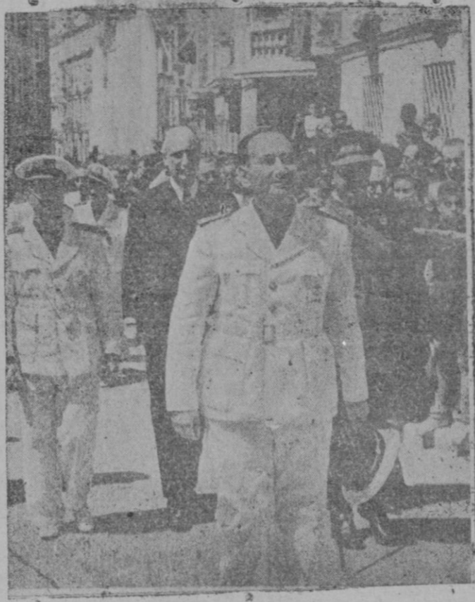
El Ministro Secretario del Partido, Sr. Arrese, al atravesar las calles de Málaga, entre las aclamaciones del público

Es una nueva prueba, que nos complacemos en señalar, de la prudente actuación de la Junta Superior de Precios, que tantas pruebas viene dando de su competencia y utilidad.