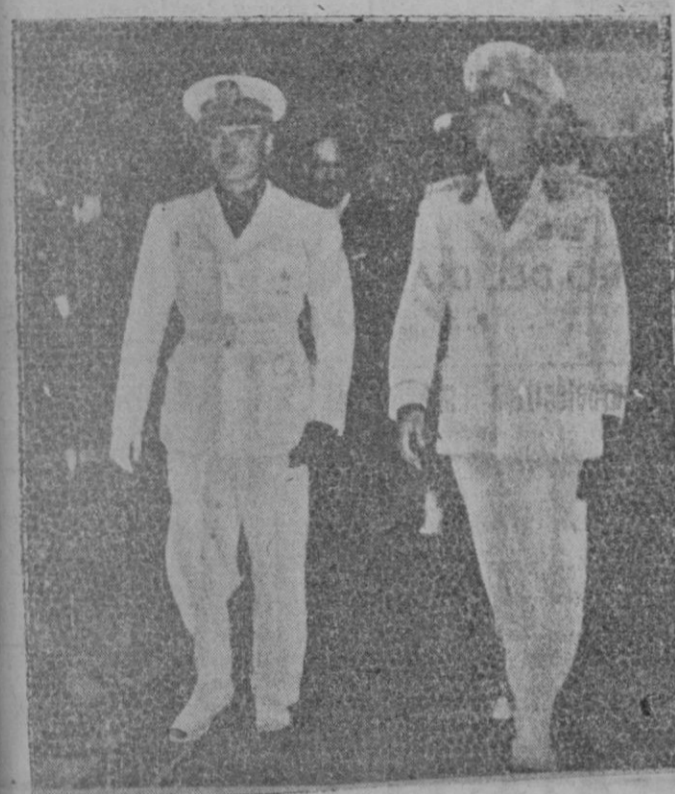
Nuestro Ministro de Asuntos Exteriores con el Conde Ciano al entrar en Roma

El Caudillo, en su reciente visita a la ciudad de Egara, se interesó personalmente por los trabajos que se verifican en el laboratorio dedicado a la retama, y, apreciando su valor, acaba de dar disposición que permitirá avanzar en el programa autárquico de Nueva España.