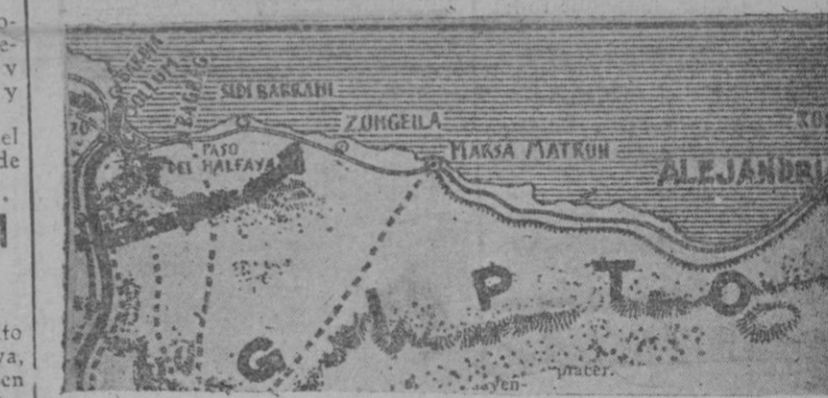
Se lucha ya en Egipto. — La flecha indica el ancho avance de las tropas de Rommel