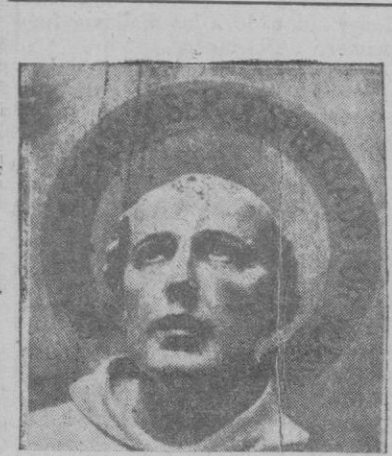
San Juan de la Cruz, escultura de Ricardo, para el monumento elevado al gran místico en Fonveros, su pueblo natal