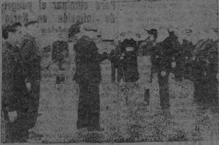
El jefe provincial del Movimiento leyendo su discurso frente a la Cruz de los Caídos.

Nada han perdido de su pristine vigor las razones que movieron al Caudillo a pedir e imponer la unificación de todos, tanto en lo interno como en lo externo.