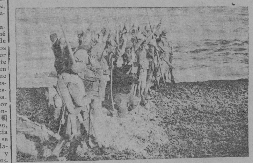
Momento emocionante de la gloriosa campaña de liberación: Las tropas de Franco al llegar al Mediterráneo

Debes ir hoy a presenciar el Desfile con que ha de conmemorarse la Victoria. Recuerda que a ese Ejército debes el haber recuperado la Patria.