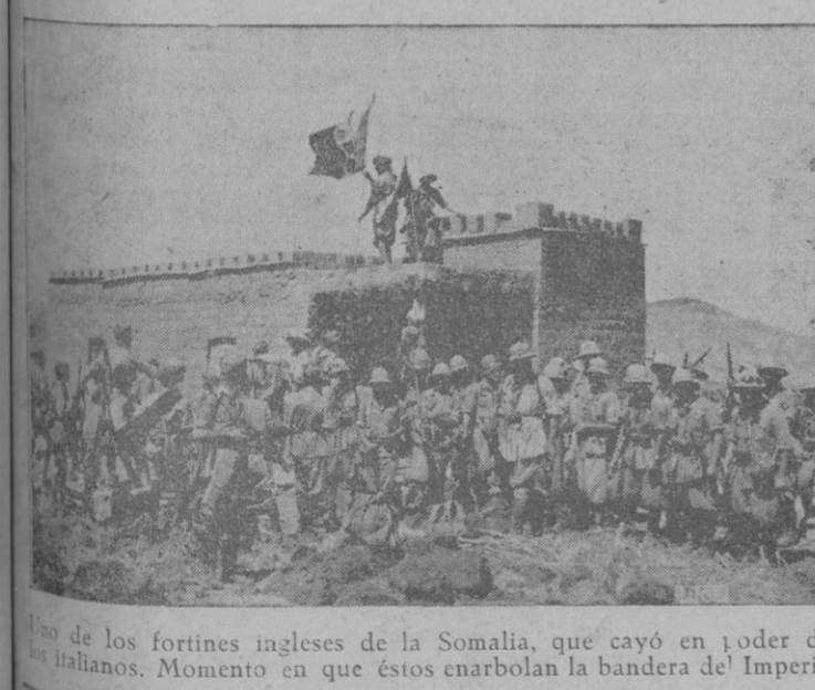
Uno de los fortines ingleses de la Somalia, que cayó en poder de los italianos. Momento en que éstos enarbolan la bandera del Imperio