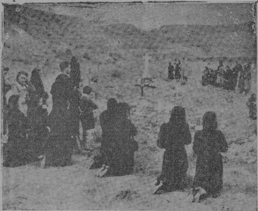
Paracuellos del Jarama, donde fueron asesinados por los rojos 10.000 patriotas. Las familias de los asesinados, rezan

Londres.—El "New Chronicle" continúa su campaña en demanda de una exposición clara y concreta de las finalidades de guerra. Publica un acuerdo de los representantes laicos de toda la Iglesia cristiana de Inglaterra invitando al Gobierno a convocar una conferencia de la paz. El mismo periódico reproduce una declaración del vicepresidente