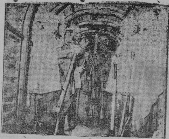
En Inglaterra se ejecutan obras subterráneas para la defensa contra aviones. La foto representa la disposición de los soldados en su interior.