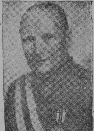
El general de División don Miguel Ponte y Manso de Zúñiga, nuevo Comandante General de Baleares

"Fué el gran Templo de la Catedral Iglesia, el Teatro donde se juntó el más grave, noble, docto y numeroso Concurso que se avia visto en siglos; llenándose su capacidad inmensa (que solo este día no pareció demasiada) más allá de lo que se extendía la esfera de la Voz y de el oído, con tan alto silencio y atención tan profunda como si pronunciará Oráculos el Predicador. Cogimos en frutos quanto derramaran sus labios en bellas peregrinas flores que nos trajo de su ameno fértil Paraíso; que es y fué lo mesmo que enriquecernos los que le llegamos a entender (cuán pocos serian los que debieron entender aquella nebulosa!) con la preciosidad de sus discursos y sutiles pensamientos porque