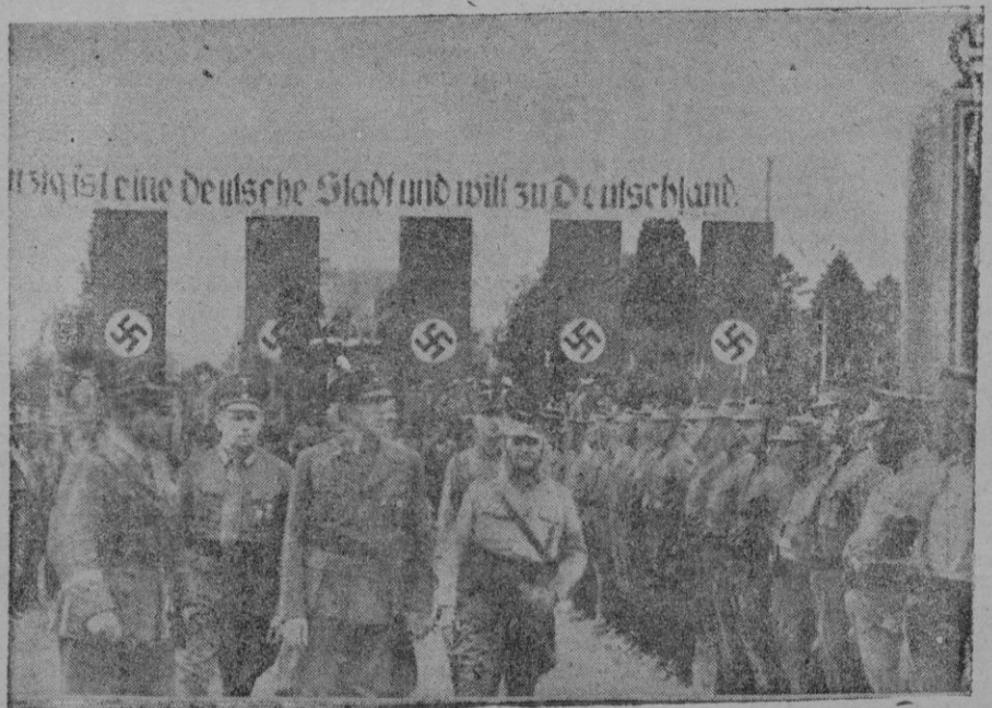
El jefe del partido nacional-socialista de Dantzig, Forster, pasa revista a las formaciones del partido, realizada para expresar el deseo de unirse al Reich