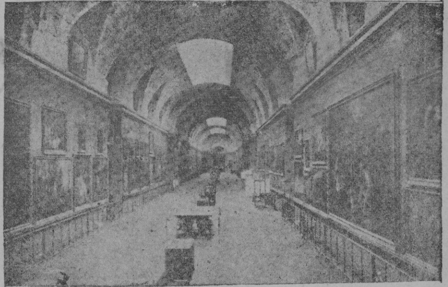
La galería del Museo del Prado

En manos del señor Serrano Suñer han depositado la ofrenda los periodistas, pudiendo observar como se emocionaba el joven Ministro al recibirla, agradeciendo en nombre del Caudillo la patriótica gesta y prometiendo redactar la leyenda que figurará en las alianzas de hierro ofrecidas a los que se desprendieron de las suyas de oro, que pasaron ya al gran crisol de España donde va afluyendo el oro lleno de fulgores con la magnífica aleación del sentimiento de todo el que se precia de buen español.