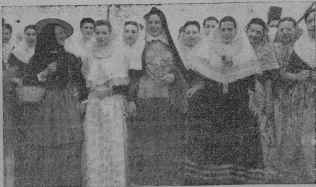
Al regreso de Medina del Campo. -- Nuestras falangistas con los trajes típicos de Baleares al llegar a Palma